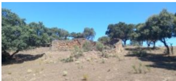
Imagen 8. Vista general del muro de Cumbre I

Referencias históricas: La tradición oral de Mata de Alcántara la reconoce con el nombre de “Muro de La Cumbre” al encontrarse en el interior de ese paraje.