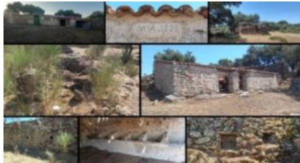
Imagen 2. Detalle de restos de muros de corrales y muros apiarios

Las medidas de los muros rondan en su gran mayoría entre los 2 y 3 m de altura, con una altura media de 2,5 m, aunque en Naverrino se conserva una altura máxima de 1,5 m y Cumbre 3 tiene una altura máxima de 1,2 m.