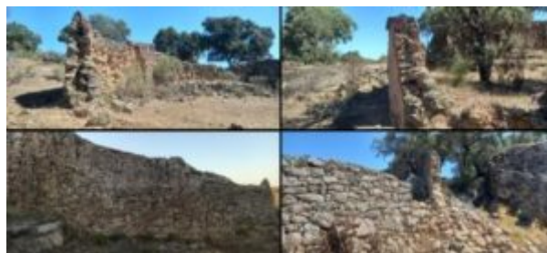
Imagen 3. Detalle de estrechamiento superior y alero

El muro de Caraciolo se estrecha considerablemente en la parte superior, en la que recientemente se han colocado tejas y sólo se ha localizado alero en el muro de cumbre 2. El alero o el estrechamiento del muro se utilizaba para dificultar el acceso al interior del recinto. En esta zona concretamente para evitar el robo de miel del interior por parte de la población cercana de Ceclavín.