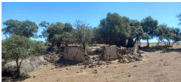
Imagen 9. Vista general del muro de la cumbre 2

Referencias históricas: La tradición oral de Mata de Alcántara lo conoce como “Muro de la Cumbre en el Parrete”.