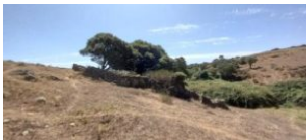
Imagen 10. Vista general corral Arropalma

Referencias históricas: La tradición oral de Mata de Alcántara la reconoce con el nombre de “Arropalma” al encontrarse en el interior de ese paraje.