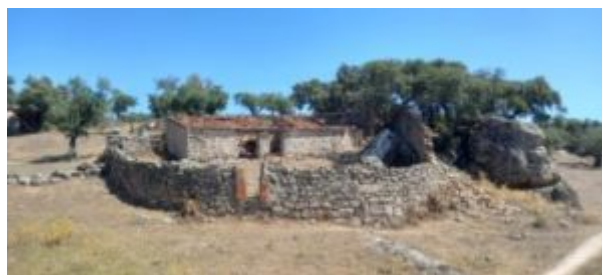
Imagen 7. Vista general del muro de Bocanegra