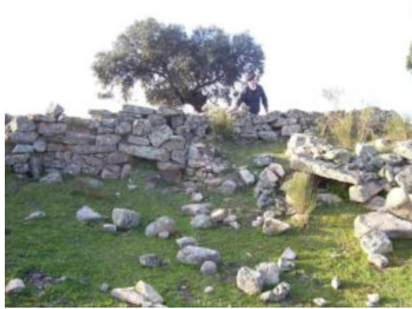
Imagen 6. Detalle zahurdas muro de Naverrino