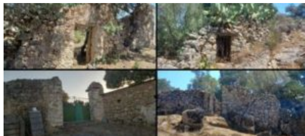
Imagen 5. Detalle de puertas de muros y corrales

Finalmente, se observa que en la mayoría de construcciones que conserva la apertura de la puerta, y que ésta no ha sido modificada para uso ganadero, en el cual se ha ensanchado, es de pequeñas dimensiones.