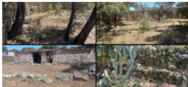
Imagen 4. Detalle de restos de bancales de muros y corrales

No obstante, sí se han conservado algunos bancales, utilizados para la colocación de las colmenas de corcho en el interior de algunos muros tales como: Arropalma, Bocanegra, Rui Páez, Cumbre 2 y Pimiento Molido, un 50% de las construcciones.