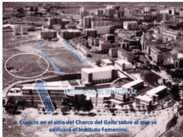
IMAGEN 3. Fotografía antigua de Cáceres con localización del espacio en el que se construyó en instituto Femenino.

Entendemos, a partir de este documento, que el solar elegido –en el sitio del Charco del Gallo- era espacio reservado para zona verde con suelo protegido no edificable (recuérdese lo que hemos indicado sobre la antigua aspiración a convertir esta zona en parque municipal) y que, para poder edificar un edificio de las características de un instituto de enseñanza, requería necesariamente su reconversión en suelo edificable con la calificación, como se ha visto, de Intensiva Alta.