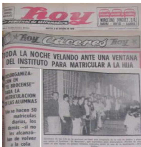
IMAGEN 9. Recorte prensa. HOY, 6 de octubre de 1970

Finalmente, entre los días 26 y 28 de octubre tanto el Extremadura como el HOY informaban de la proximidad de la apertura del curso escolar que se produciría el viernes 30 de octubre, notificando, además, el horario en que se procedería a la recepción de las alumnas a lo largo del día según su nivel escolar.