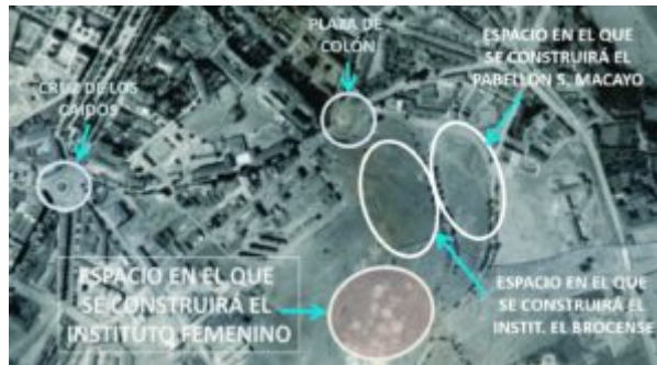
IMAGEN 2. Ortoimagen de Cáceres en 1961. Adaptación.

Cáceres tenía proyectado la construcción de un parque de esparcimiento para la ciudad.