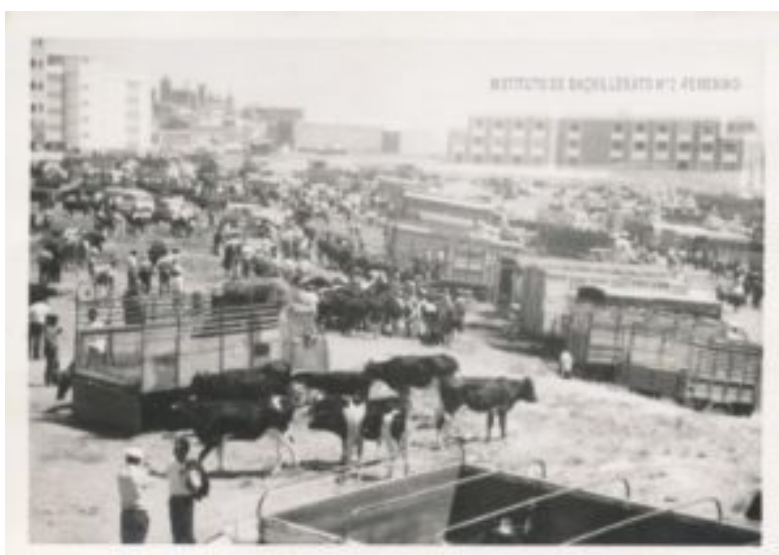
IMAGEN 5. Primera fotografía conservada en la que aparece el edificio central ya construido del hoy

En la que, creemos, es la fotografía más antigua conservada del hoy IES Norba Caesarina, - parte superior de la fotografía, a la derecha-, cuya fecha probable es en la feria de ganado de mayo de 1971, puede apreciarse el espacio explanado para la construcción de la que aparece definida en el proyecto como pista de tenis.