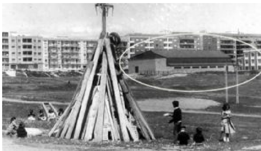
IMAGEN 6. Fotografía antigua en la que se aprecia el pabellón de deportes

■ El proyecto complementario de “Reparación y Reposición de pavimentos, aseos, cubierta y carpintería de I.N.B.F. de Cáceres” , firmado por el arquitecto Juan I. Estruch Nieto en octubre de 1977, proyectó la cubrición y cerramiento de las instalaciones de la pista polideportiva de 20 x 40 que, hasta ese momento, eran pista descubierta. Se preveía, además, calefacción, altavoces, mesa para jueces, así como marcador manual y reloj contador. El presupuesto final ascendía hasta casi los 5 millones de pesetas (4.992.906,96 ptas.) 14 .