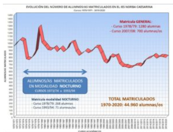
IMAGEN 10. Evolución del número de alumnas y alumnos 1970-2020

cursos 1970-1971 y 2019-2020. Debe tenerse en cuenta que entre los cursos 1973-1974 y 1993-1994 el instituto contó, además de con la modalidad diurna, con la modalidad de estudios nocturnos (cuyo alumnado varió desde los 268 en el curso 1978-1979 hasta los 71 alumnos/as en el curso 1993-1994).