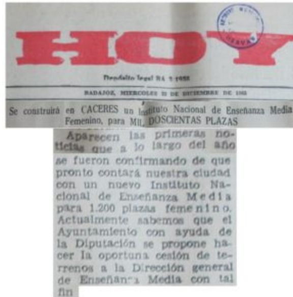
IMAGEN 1: Recorte de prensa. HOY, 22 diciembre 1965

Este artículo de prensa nos informa, además, de que el Ayuntamiento de Cáceres contó con la colaboración de la Diputación Provincial para la adquisición de los terrenos necesarios para la construcción del instituto.