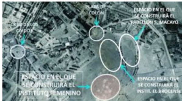
IMAGEN 2. Ortoimagen de Cáceres en 1961. Adaptación.

Cáceres tenía proyectado la construcción de un parque de esparcimiento para la ciudad.