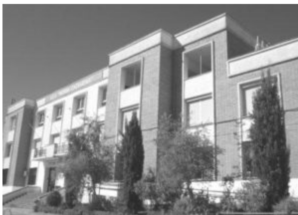
IMAGEN 8. Fachada actual del IES Norba Caesarina

El patio del recreo, los jardines y las instalaciones deportivas, que no se construyeron en una primera fase, se situaron en los lados libres del solar -al sur y al oeste del edificio construido- limitados por vallas de baja altura cuya función, además de cerramiento, contribuye a crear un espacio físico diferenciado, como suele ser característico en los edificios docentes.