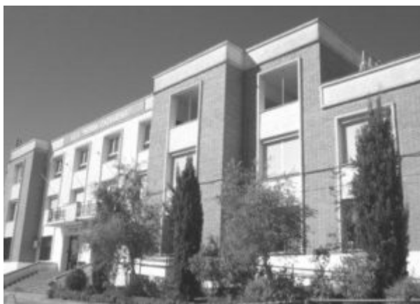
IMAGEN 8. Fachada actual del IES Norba Caesarina

El patio del recreo, los jardines y las instalaciones deportivas, que no se construyeron en una primera fase, se situaron en los lados libres del solar -al sur y al oeste del edificio construido- limitados por vallas de baja altura cuya función, además de cerramiento, contribuye a crear un espacio físico diferenciado, como suele ser característico en los edificios docentes.