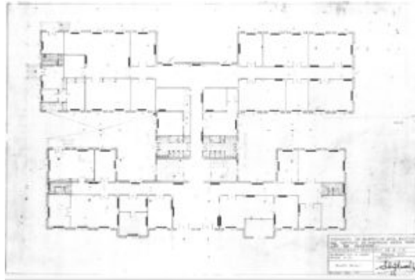
IMAGEN 4. Plano de planta baja del Instituto Femenino. Reforma 1971.