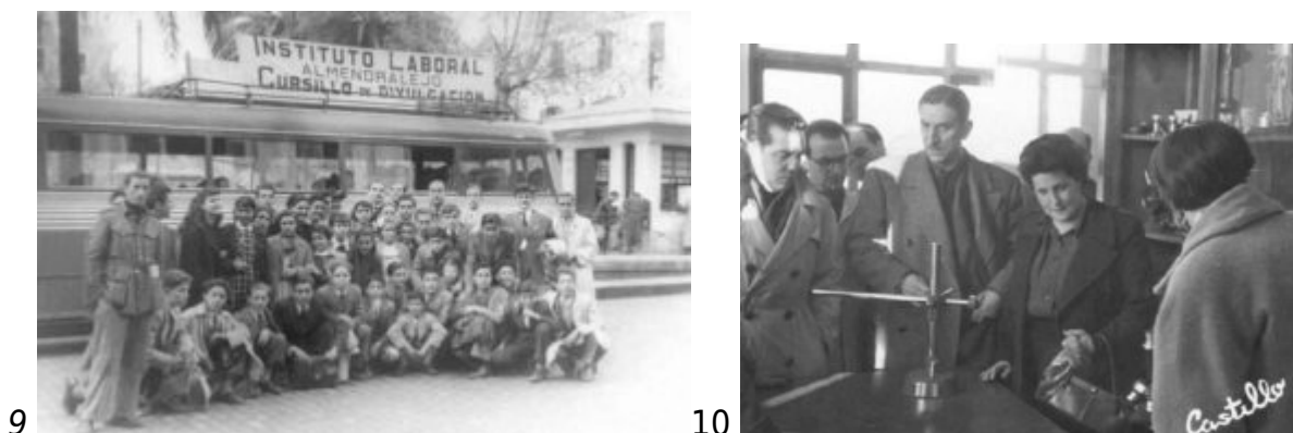
Fig 9 y 10. Excursión a Mérida, en 1953, y visita de doña Pilar Primo de Rivera, en 1953.

diferentes momentos de la vida de un centro de enseñanza en sus muchas facetas y variables, como quedó dicho, como profesorado en actitudes no docentes, festividades, biblioteca, radio escolar, protocolo, publicaciones, jubilaciones y homenajes, jornadas, premios, etc. (Fig. 9 y 10).