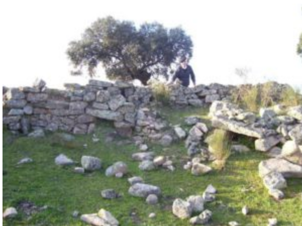
Imagen 6. Detalle zahurdas muro de Naverrino

Referencias históricas: La tradición oral de Mata de Alcántara la reconoce con el nombre de “Muro Naverrino” al encontrarse en el interior de ese paraje.