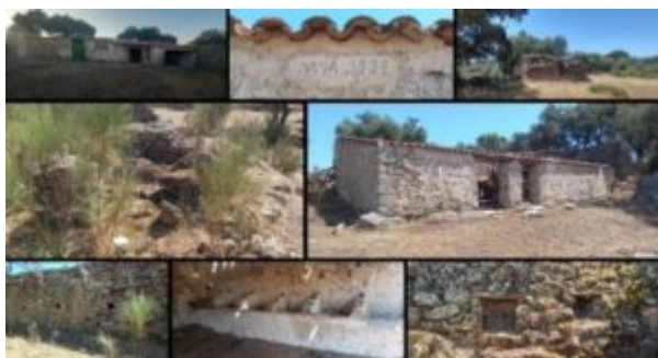
Imagen 2. Detalle de restos de muros de corrales y muros apiarios

Las medidas de los muros rondan en su gran mayoría entre los 2 y 3 m de altura, con una altura media de 2,5 m, aunque en Naverrino se conserva una altura máxima de 1,5 m y Cumbre 3 tiene una altura máxima de 1,2 m.