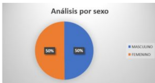
Cuadro 3. Análisis por sexo de las defunciones producidas en Villar del Rey