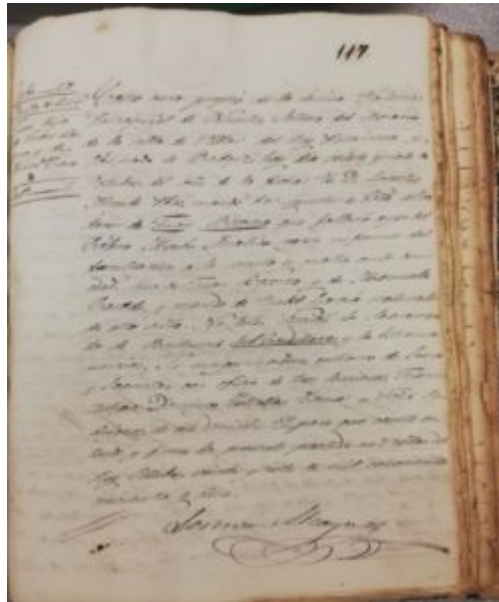
Cuadro 1. Ejemplo de partida de defunción (Villar del Rey, 1855)[32]

Como podemos observar, los libros sacramentales son importantes fuentes para la realización de estudios demográficos. A partir de un pequeño párrafo, varios son los datos que se pueden extraer, permitiendo el análisis de diversas variables de carácter cuantitativo.