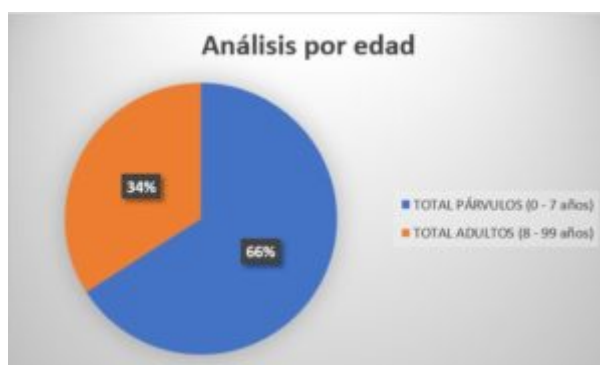
Cuadro 4. Análisis por edad de las defunciones producidas en Villar del Rey (2)

En la exposición de los resultados obtenidos en los diversos tipos de análisis empleados, hemos podido observar un predominio en la mortalidad de párvulos. De acuerdo con estos datos podemos establecer la premisa de que la tasa de mortalidad infantil fue muy elevada,