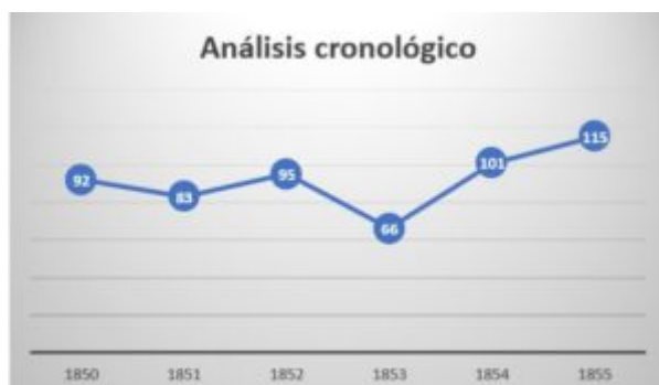
Cuadro 2. Análisis cronológico de las defunciones producidas en Villar del Rey

Durante el período estudiado, España se caracterizaría por el reinado de Isabel II (1843 – 1870) y las consecuencias acontecidas tras las “ Guerras Carlistas ” [33] . Suponemos que las repercusiones producidas por las incontables guerrillas ocasionadas en Extremadura [34] podrían ser un detonante para la alta tasa de mortalidad, debido principalmente a las consecuencias económicas, políticas y sanitarias que estos actos conllevarían a la comunidad.