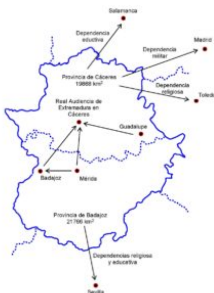
Figura 3. Esquema simplificado del territorio de Extremadura, dividido en dos provincias en 1833, con unidad en lo judicial y dependientes de otras provincias en los ámbitos militar, religioso y educativo antes de 1973.

Cáceres en el norte y Badajoz en el sur (Figura 3); ambas recibieron algunas poblaciones de otras regiones y cedieron otras, resultando la extensión de Cáceres menor que Badajoz. En el ámbito militar, la Alta Extremadura perteneció a la Capitanía General de Madrid y la Baja Extremadura a la de Sevilla. En el ámbito religioso, dependientes de los arzobispados de Toledo y Sevilla, respectivamente. Y en el ámbito educativo, la provincia de Cáceres perteneció a la USAL y la de Badajoz a la US.