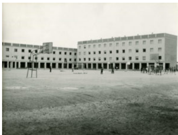
Figura 6. Colegio de Salesianos “Ramón Izquierdo”, sede inicial la Facultad de Ciencias de Badajoz (pabellón de la izquierda) desde el 5 de noviembre de 1968 hasta el curso académico 1971-1972.

El primer curso de Ciencias Químicas y de Escuelas Técnicas Superiores se impartieron inicialmente a aproximadamente 100 alumnos en una parte del Colegio de Salesianos “Ramón Izquierdo” de la capital pacense (Figura 6). Allí siguió hasta 1972, pasando al edificio que se construyó en los terrenos antes mencionados.