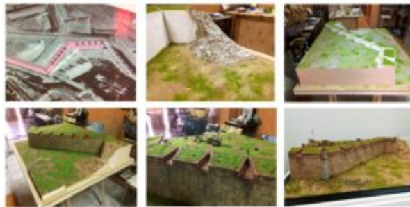
Imagen nº 7: Secuencia de construcción del diorama.

En la secuencia de fotos que sigue podemos ver parte del proceso de construcción de dicho diorama y el resultado final.