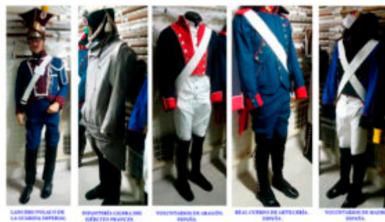
Imagen Nº 8: Colección de maniqués cedidos por el Museo.

Al tratarse de reproducciones y encontrarse en muy buen estado, estas piezas no necesitarían de ninguna intervención antes de ser expuestas.