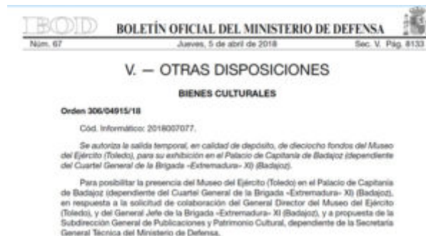
Imagen nº 10: Resolución de autorización de salida temporal de las piezas del Museo del Ejército para exhibición en el Palacio de Capitanía de Badajoz.

Después de un largo camino, se completaron las acciones preliminares por lo que el Museo del Ejército formalizó la cesión de las piezas seleccionadas mediante la Orden 306/04915/19 publicada en el Boletín Oficial de Defensa nº 67 de 5 de abril de 2018.