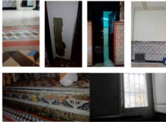
Imagen nº 9: Estado de las salas antes de la intervención.