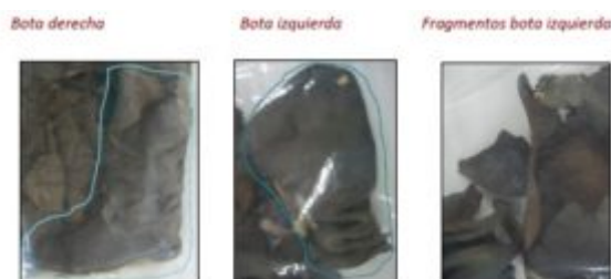
Imagen nº 3: Fotografías que acompañan a la propuesta de restauración de las botas.

Limpieza mecánica Sopa Cleaner para piel, esponja de humo y esponja Wishab de baja dureza. Hidratación con adobe Renaissnce. Fijación de fragmentos sueltos con Henkel. Soporte de relleno (para dar volumen) realizado con tubión teñido y gauta de poliéster.”