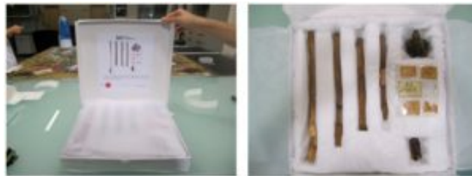
Imagen nº 5: Restos óseos atribuidos al general Menacho.

también fue restaurado, con cargo a Fundación CB, pero su cesión para el proyecto no fue aprobada, razón por la que permanecieron en los almacenes del Alcázar de Toledo.