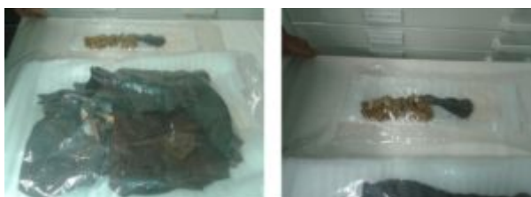
Imagen nº 2: Estado de las piezas depositadas en el Museo, antes de la restauración.

Museo me enseñaron dos bolsas de plástico selladas al vacío con un amasijo de “trapos” en su interior.