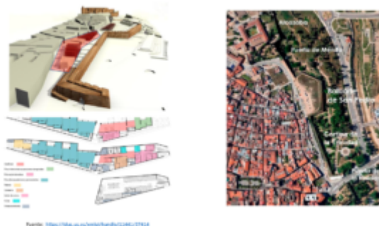
Imagen nº 1: Proyecto para un museo militar en Badajoz. Autor Carlos Bravo Gómez.