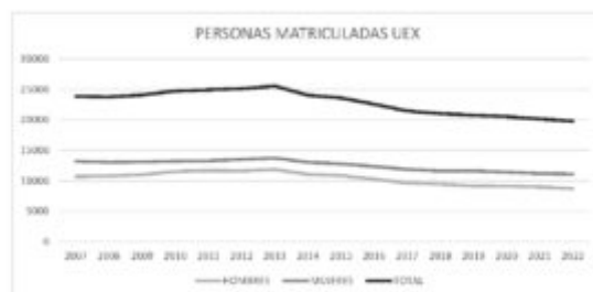
Figura 14. Evolución de la matriculación en la UEx.

La Figura 14 muestra la evolución del alumnado matriculado de la UEx, en la que se puede observar que la matriculación de mujeres se ha mantenido superior a la de hombres, ambas con máximos en 2013, con un total que superó las 25 000 matriculaciones, y que a partir de ese año caen.