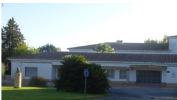
Figura 8. Exterior del edificio de la Fundación Fernando Valhondo Calaff, en Avenida de los Quijotes de Cáceres, sede del Colegio Universitario de Filosofía y Letras, inaugurado el 16 de octubre de 1971. En el mismo edificio se iniciaron la Facultad de Derecho y la Escuela de Ingenieros Técnicos de Obras Públicas.