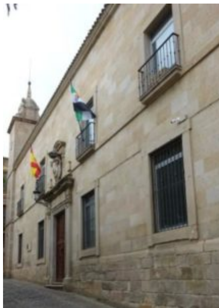
Figura 2. Fachada principal del edificio del Tribunal Superior de Justicia de Extremadura, antes Palacio de Justicia de Cáceres, donde tuvo su sede la Real Audiencia Territorial de Extremadura, inaugurada en 1791.

Aunque Extremadura alborea en los siglos anteriores, fue en la Ilustración española (1700-1808 o 1814) cuando hubo un primer reconocimiento administrativo como Región al crearse la Real Audiencia Territorial de Extremadura en Cáceres, reinando Carlos IV, pues hasta entonces dependía de la de Valladolid; hoy es el Tribunal Superior de Justicia de Extremadura. En la fachada principal del edificio actual (Figura 2) una placa dice que “el edificio había sido desde mediados del siglo XVI Hospital de la Piedad, del cual se conserva el hermoso patio central y la escalera, que se reformó en 1790 para ser sede de la nueva audiencia territorial, y que se eligió Cáceres ...por ser más sano, mejor surtido, más poblada y más oportuno de aquella Provincia...”