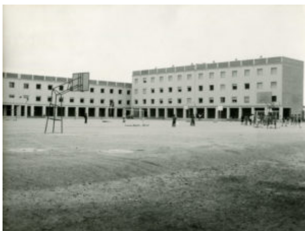
Figura 6. Colegio de Salesianos “Ramón Izquierdo”, sede inicial la Facultad de Ciencias de Badajoz (pabellón de la izquierda) desde el 5 de noviembre de 1968 hasta el curso académico 1971-1972.

El primer curso de Ciencias Químicas y de Escuelas Técnicas Superiores se impartieron inicialmente a aproximadamente 100 alumnos en una parte del Colegio de Salesianos “Ramón Izquierdo” de la capital pacense (Figura 6). Allí siguió hasta 1972, pasando al edificio que se construyó en los terrenos antes mencionados.