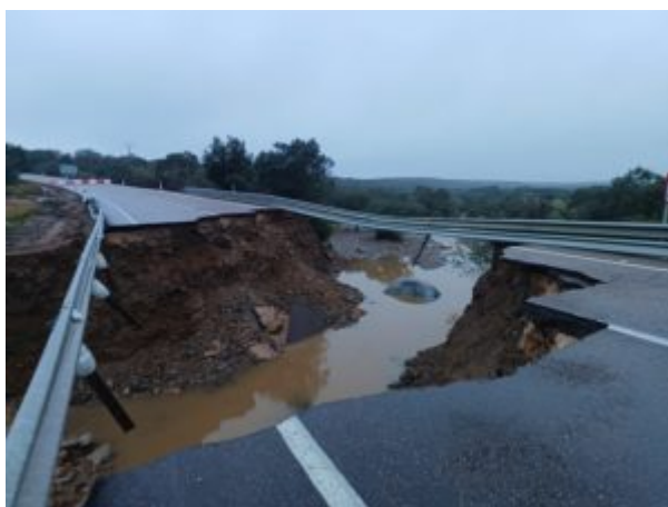
Figura 10. Rotura del asfalto y socavón en la carretera N-523 producido el 13 de diciembre de 2023.

En La Tabla 4 figura información de los nuevos centros universitarios que se crearon en los cursos académicos 1073-1974 y 1974-197. Se creó la Escuela de Estudios Empresariales de Badajoz, ya que era la única región de España que se iba a quedar sin estos estudios[34]; la Facultad de Medicina de Badajoz, a la que se adscribieron Escuelas de ATS; la Facultad de Derecho de Cáceres y la Facultad de Filología de Cáceres, que se convirtió en Facultad de Filosofía y Letras (Secciones de Filología y Geografía e Historia) en 1974. En el año 1975 se crearon la Escuela Universitaria de Ingeniería Técnica Industrial de Badajoz y Escuela de Ingenieros Técnicos de Obras Públicas de Cáceres al mismo tiempo. Así pues, los nuevos centros universitarios se creaban en armonía con el decreto de creación de la UEx.