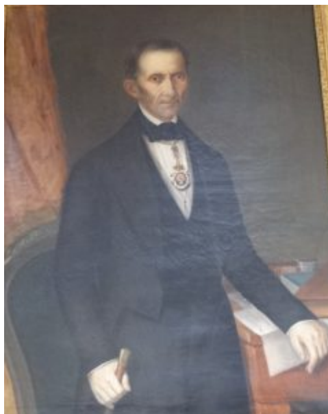
Figura 4. Retrato de Pedro Pablo Montesino y Cáceres.

Guerra de la Independencia (1808-1814). Este liberal impulsó la educación en todos sus niveles en España tras regresar en 1834 de su exilio político en Inglaterra. En particular, impulsó la formación de maestros en las llamadas Escuelas Normales; logró la inauguración de la primera Escuela Normal masculina de España en Madrid, el 8 de marzo de 1839 con la denominación provisional de Seminario Central de maestros del Reino, en el edificio que es hoy el Instituto de Educación Secundaria Lope de Vega (calle San Bernardo, 70), siendo él su primer director (Figura 4)[17]. Las Escuela Normal femenina de Madrid se estableció tras la Ley de Instrucción Pública de 9 de septiembre 1857, del ministro de Fomento Claudio Moyano y Samaniego. Las Escuelas Normales provinciales, masculinas y femeninas, se establecieron en las décadas de 1840 y 1850, respectivamente, sin integración en las universidades españolas decimonónicas.