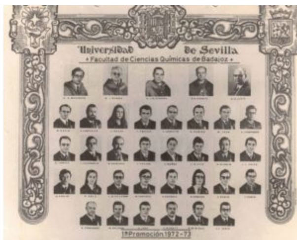
Figura 7. Orla de la primera promoción de Ciencias Químicas (1968-1973) de la Facultad Ciencias de Badajoz, dependiente de la US hasta la creación de la UEx en 1973.