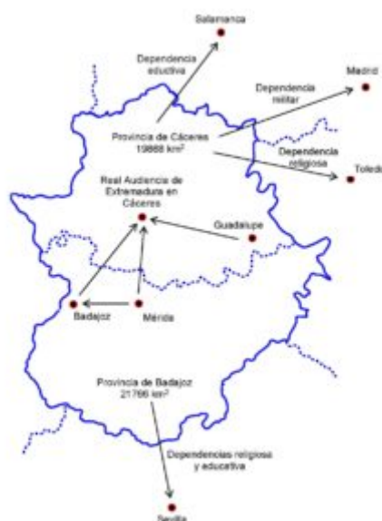
Figura 3. Esquema simplificado del territorio de Extremadura, dividido en dos provincias en 1833, con unidad en lo judicial y dependientes de otras provincias en los ámbitos militar, religioso y educativo antes de 1973.

Cáceres en el norte y Badajoz en el sur (Figura 3); ambas recibieron algunas poblaciones de otras regiones y cedieron otras, resultando la extensión de Cáceres menor que Badajoz. En el ámbito militar, la Alta Extremadura perteneció a la Capitanía General de Madrid y la Baja Extremadura a la de Sevilla. En el ámbito religioso, dependientes de los arzobispados de Toledo y Sevilla, respectivamente. Y en el ámbito educativo, la provincia de Cáceres perteneció a la USAL y la de Badajoz a la US.