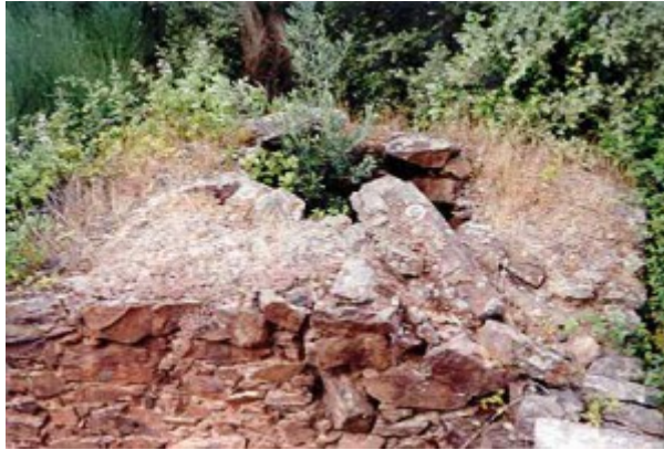
Las Vegas. Construido de pizarras.