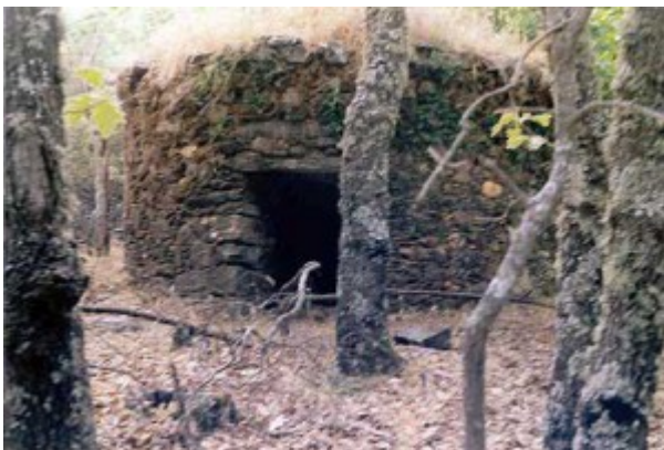
Paraje «El Pinche» , construido de pizarras carbonosas.