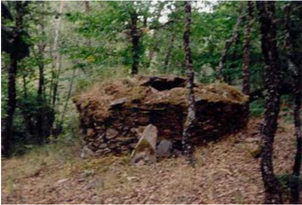
Paraje «El Bardal», piedras de arena arcilla.