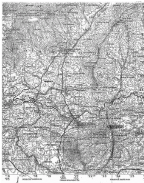
Mapa de la zona

Esta Arquitectura popular pastoril, llamada arquitectura negra, se repite por toda la geografía y especialmente por nuestra Sierra de Gata. El chozo de ramaje y forma cónica, en esta comarca ha desaparecido totalmente por perder su funcionalidad. En cambio el muro, construcción pétreo sigue desafiando el tiempo y nos está diciendo que lo miremos y mimemos para seguir manifestando una cultura celta, que fue la de nuestros ancestros velones. Conservemos los muros.