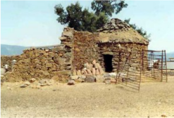
Paraje «Laguna Vieja» , construido de pizarra arenarcillosa.