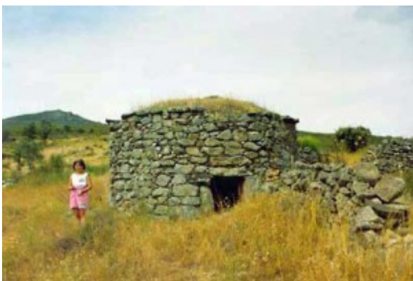
Pasaje Arroyo de «La Degollá» , construido de granito. Está en el límite de la unidad granítica de Bejar-Plasencia.