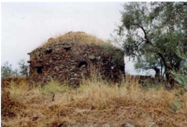
Paraje «Valle del melonar» , construido de pizarra terreno-aluvial.