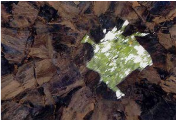
Falsa cúpula del muro del Madroñal. Se aprecian las hiladas de piedra que cierran la cúpula.