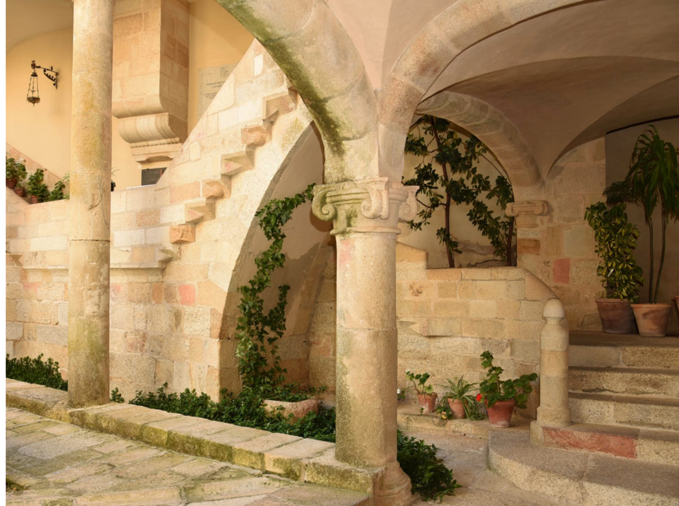
Convento de San Francisco el Real de la Puerta de la Coria

A.C. Coloquios Históricos de Extremadura