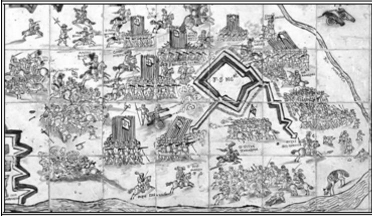
Lám. 3. Tomada do Forte de São Miguel, Palacio del Marquês da Fronteira, Lisboa (detalle).

Llegó el Sr. Don Luis de Aro, el Duque de San Germán con toda la Corte por la tarde a esta plaza, y fueron a desmontar a la Iglesia Cathedral donde con el Santissimo manifiesto, se cantó el Te Deum con toda solemnidad. ( Relación de la campaña... , Mascareñas, folio 38)