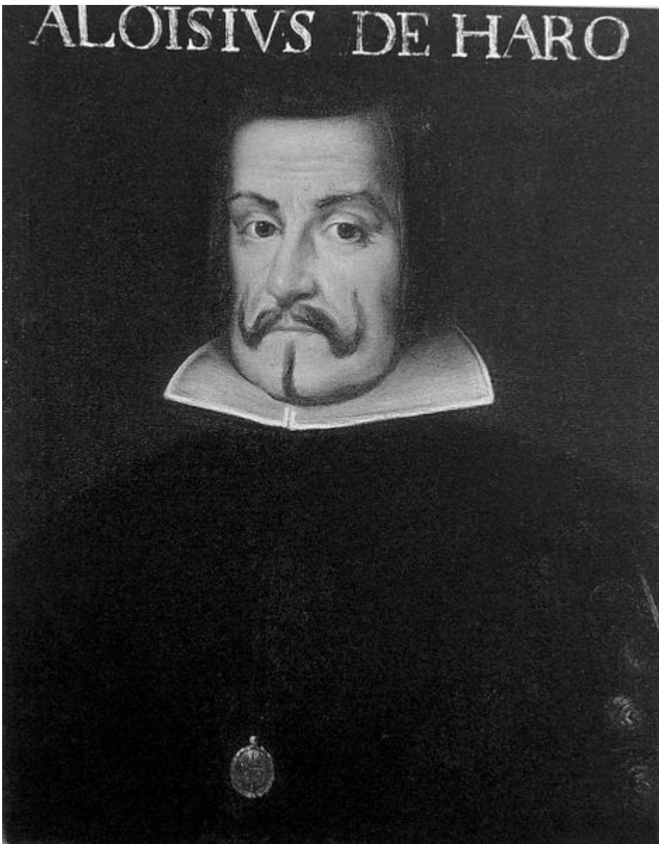
Lám. 4. D. Luis Méndez de Haro, Marqués del Carpio, (Galeria Uffizi, Florencia).

Hasta el 23 de julio no lograron cerrar la circunvalación, pero las obras exteriores de la ciudad les habían obligado a hacerlo a una distancia tan grande que difícilmente tenían tropas suficientes para impermeabilizarla. Así los correos no tenían dificultad para atravesarla de noche y los convoyes de suministros estuvieron entrando hasta el 5 de agosto.