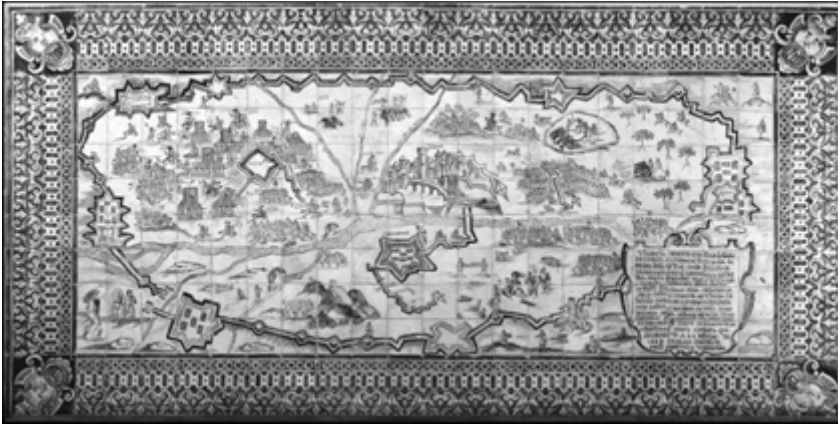
Lám. 6. A tomada do forte de S. Miguel , Palacio del Marquês da Fronteira (Lisboa, Portugal) , 1658.

1 Del Libro de Acuerdos Capitulares , de 3 de diciembre de 1637. Archivo Municipal de Badajoz (ápuđ Cortés, 1985, 8)