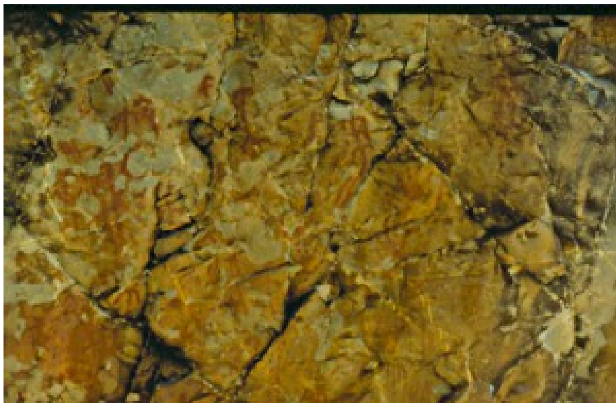
Lámina I.- Gran panel del Risquillo de Paulino

de Rosa, termina en un semicírculo radiado; mayor simplificación tienen el de Malpartida de Cáceres I-III, canchal de los Berruecos. Este signo parece de tradición megalítica como lo confirma el grabado en el dolmen de Magacela ( 15 ); formalmente no desentonan de una representación esquemática del Arbol de la Vida; en el caso que ahora os presento es evidente una asociación entre ancorados y ramiformes que pueden indicar algún tipo de sincretismo entre estas dos divinidades.