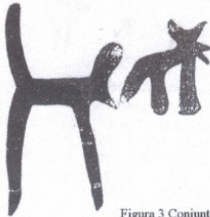
Figura 3 Conjunto V

Como a un metro de distancia hacia la derecha del anterior conjunto se encuentra este otro realizado con trazo igualmente rojo y grueso. Representa de manera sumamente esquemática a dos cuadrúpedos. El número 1 se dotó de larga y gruesa cola, muy erguida; en la parte derecha del tronco, no muy voluminoso, parece señalada la cabeza en la que es visible un tupido manchón correspondiente a amplias orejas; en la parte inferior un afilado hocico; las extremidades, en número de dos, largas y gruesas.