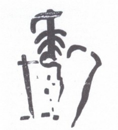
Figura 6. Conjunto VII

Este nuevo conjunto está situado más o menos un metro hacia la derecha algo superiormente. Su trazo es bastante grueso y el colorido es oscuro tirando a violáceo. Consta de dos figuras, la número 1 es un ramiforme conseguido con un ancorado simple de cuello apuntado al que se han añadido inferiormente tres pares de trazos más cortos que el superior lo que indica un sincretismo de las formas ancoradas con las ramiformes; su parte inferior presenta una alteración en las extremidades más bajas; la izquierda se dobló en semicírculo hacia abajo traspasando el eje central para terminar enseguida formando tres cortos escalones; el par correspondiente a la parte derecha se dibujó algo más arriba del eje central y muy corto. Cerca de su terminación derecha se trazó la forma abastonada irregular número 2; su lado superior está en clara correspondencia con la parte sin pintar que deja la extremidad izquierda al finalizar el semicírculo y doblar hacia la extremidad izquierda al finalizar el semicírculo y doblar hacia abajo. En la parte baja del lado izquierdo se ven muy tenues unas formas lineales en número escaso, de ellas destaca una vertical y alguna puntuación, constituyen la forma número 3.