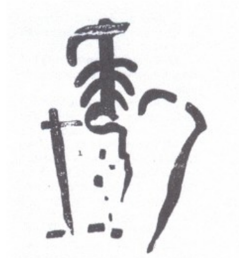
Figura 6. Conjunto VII

Este nuevo conjunto está situado más o menos un metro hacia la derecha algo superiormente. Su trazo es bastante grueso y el colorido es oscuro tirando a violáceo. Consta de dos figuras, la número 1 es un ramiforme conseguido con un ancorado simple de cuello apuntado al que se han añadido inferiormente tres pares de trazos más cortos que el superior lo que indica un sincretismo de las formas ancoradas con las ramiformes; su parte inferior presenta una alteración en las extremidades más bajas; la izquierda se dobló en semicírculo hacia abajo traspasando el eje central para terminar enseguida formando tres cortos escalones; el par correspondiente a la parte derecha se dibujó algo más arriba del eje central y muy corto. Cerca de su terminación derecha se trazó la forma abastonada irregular número 2; su lado superior está en clara correspondencia con la parte sin pintar que deja la extremidad izquierda al finalizar el semicírculo y doblar hacia la extremidad izquierda al finalizar el semicírculo y doblar hacia abajo. En la parte baja del lado izquierdo se ven muy tenues unas formas lineales en número escaso, de ellas destaca una vertical y alguna puntuación, constituyen la forma número 3.