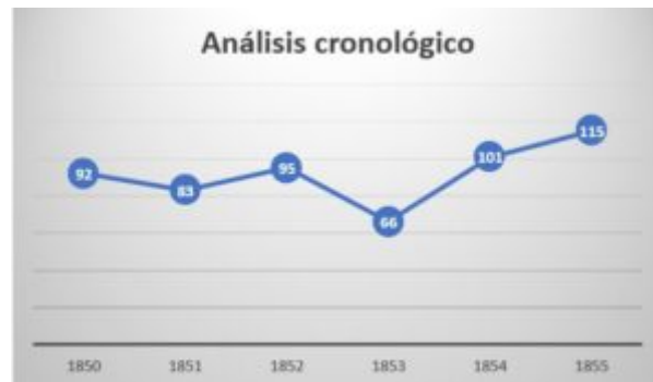
Cuadro 2. Análisis cronológico de las defunciones producidas en Villar del Rey

Durante el período estudiado, España se caracterizaría por el reinado de Isabel II (1843 - 1870) y las consecuencias acontecidas tras las “ Guerras Carlistas ” [33] . Suponemos que las repercusiones producidas por las incontables guerrillas ocasionadas en Extremadura [34] podrían ser un detonante para la alta tasa de mortalidad, debido principalmente a las consecuencias económicas, políticas y sanitarias que estos actos conllevarían a la comunidad.