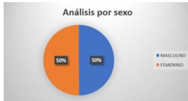
Cuadro 3. Análisis por sexo de las defunciones producidas en Villar del Rey