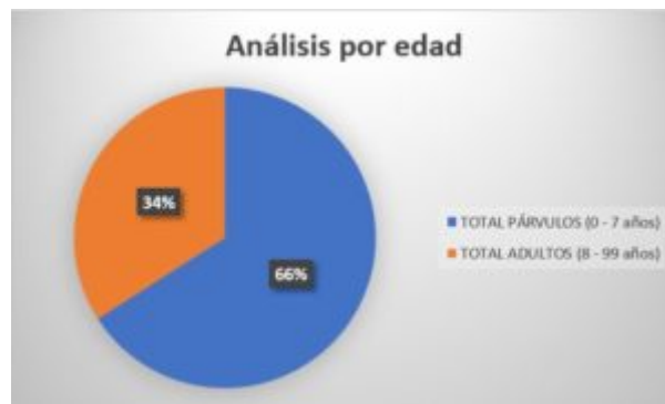
Cuadro 4. Análisis por edad de las defunciones producidas en Villar del Rey (2)

En la exposición de los resultados obtenidos en los diversos tipos de análisis empleados, hemos podido observar un predominio en la mortalidad de párvulos. De acuerdo con estos datos podemos establecer la premisa de que la tasa de mortalidad infantil fue muy elevada,