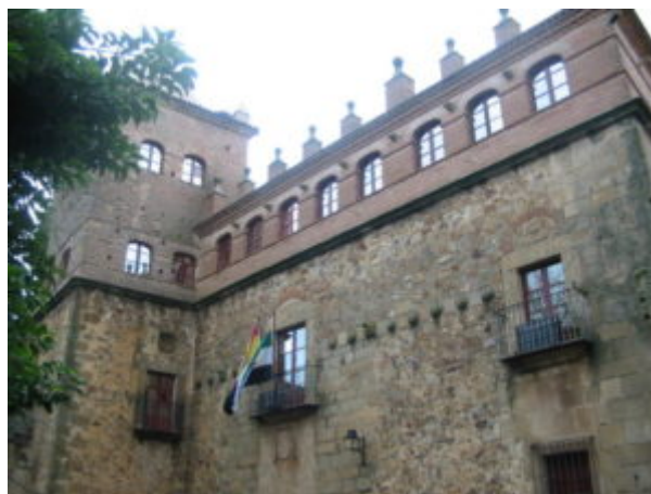
Figura 2. Fachada de la Casa o Palacio de los Toledo-Moctezuma en Cáceres, hoy Archivo Histórico Provincial de Cáceres.

Concerniente a Hispanoamérica, la huella monumental en Extremadura es frecuente. En Cáceres (Extremadura, España), es principalmente hispano-mexicana. A título de ejemplo, basta recordar la denominada Casa o Palacio de los Toledo-Moctezuma (Figura 2), que es muy anterior a la independencia de México.