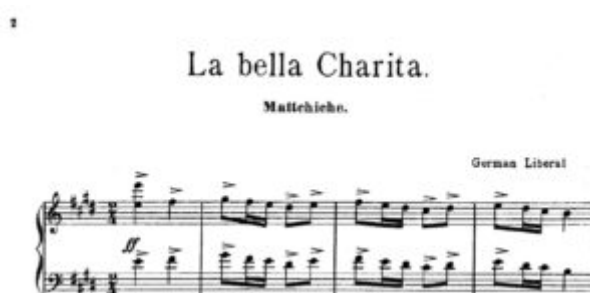
Imagen 6. Partitura de “La Bella Charita”. Matchicha perteneciente a la zarzuela “Ni tanto que queme el santo”