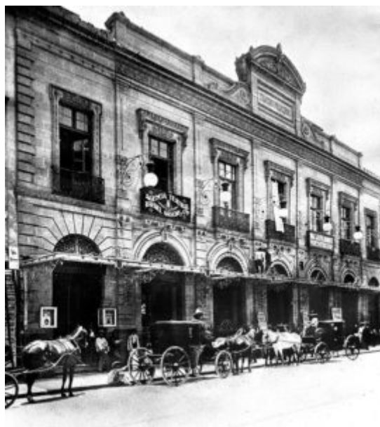
Imagen 3. Fachada del Teatro Principal de México