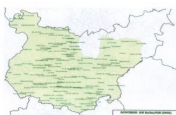
Mapa 5.- Reforma de 1958.