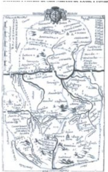
Mapa 2.- Diócesis Priorato de San Marcos de León. Provincia de León