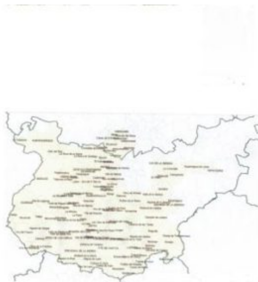
Mapa 4.- Diócesis pacense Bajoextremeña 1874.