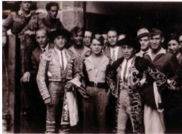
Lámina 10. Novillada. 18 julio de 1939

propósito de establecerlas en la parte posterior del parque Calvo Sotelo para que así estuvieran próximos por si hay algún circo, tiros al blanco, etc., que se colocarán en la explanada de la parte lateral del Hospital o en terrenos particulares, porque cree que debe evitarse, como en otros sitios estas aglomeraciones de espectáculos o tiendas en la Plaza Mayor y que los fuegos artificiales, deben celebrarse en la plaza de Italia, próxima a inaugurarse, no debiendo por una porción de circunstancias el Ayuntamiento contribuir a subvencionar a espectáculos como toros, etc.”[53]