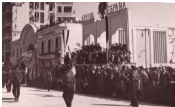
Lámina 08. Jura de bandera de Alféreces provisionales. 16 octubre 1938