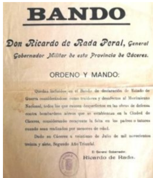
Lámina 05. Bandos hechos públicos como consecuencia del bombardeo sobre Cáceres.