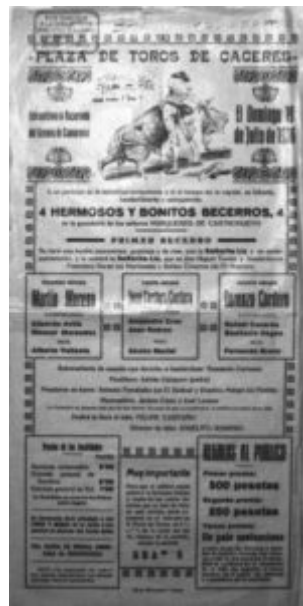
Lámina 11. Extraordinaria becerrada del gremio de los camareros. 19 julio 1936

Próximo el Corpus, “la Presidencia expone a la Corporación, que ha sido siempre tradicional sufragar por el Ayuntamiento determinados actos en la festividad del día del Corpus, sometiendo a la Comisión, lo que sobre ello ha de hacerse. Acordándose restableciendo la costumbre de otros años, sufragar por este Ayuntamiento los gastos[55] de la fiesta”[56].