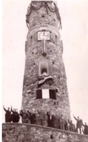
Lám 06. Inauguración de la torre en la Plaza de Italia.