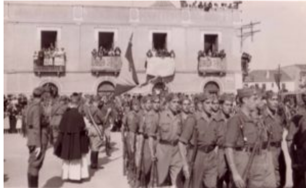
Lámina 07. Jura de bandera de Alféreces provisionales. 16 octubre 1938