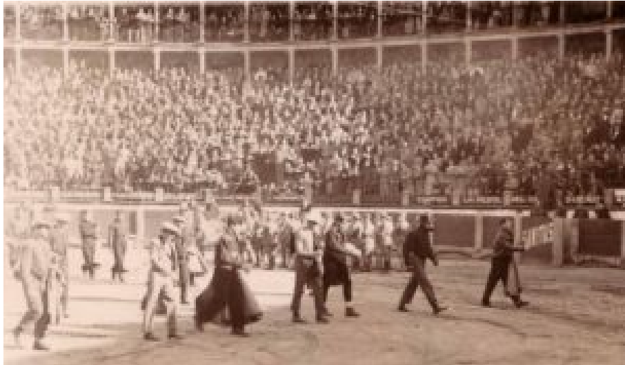
Lámina 09. Festival beneficio de la Cruz Roja. Octubre 1936

El Ayuntamiento señaló “...tres fiestas locales, una de las cuales es la de San Jorge, Patrón de la Ciudad, que corresponde al veintitrés del mes actual y que como este día coincide con la fiesta de la Patrona, la Santísima Virgen de la Montaña, cree y así lo propone a la Comisión, debe anticiparse esta de San Jorge al día veintidós, en que se celebrará también y conjuntamente la despedida de la Virgen. Que el acuerdo que se tome, si se acepta su proposición, deberá comunicarse a las Autoridades Superiores por ser una fiesta a todos los efectos siendo ellas las que tengan que dar las órdenes precisas para su celebración”[52].