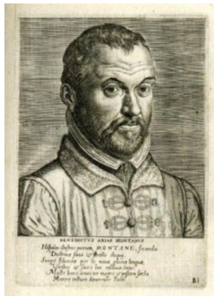
Cuadro 3. Benito Arias Montano