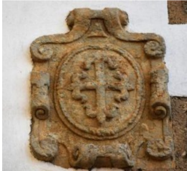
Cuadro 4. Escudo de la Orden de Alcántara