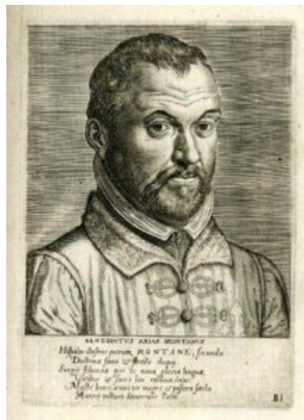
Cuadro 3. Benito Árias Montano