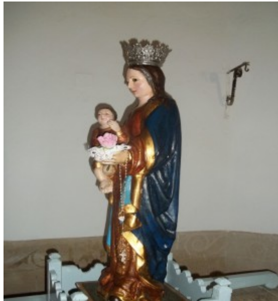
Figura 2. Imagen Nuestra Señora de los Hitos.

La talla de la Virgen de los Hitos es una talla en madera policromada de la Virgen con niño en su mano derecha, sobre peana. La Virgen mira al frente y el niño posee piernas entrecruzadas y su mano izquierda en actitud de bendecir. La Virgen en su mano izquierda posee una flor que en otro tiempo portaba un báculo y a su vez de su mano pende un rosario. Según algunos historiadores, la talla está fechada a finales del siglo XV. [27]