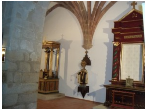
Figura 4. Capillas del lado del Evangelio.