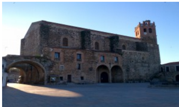
Figura 3. Iglesia Parroquial de Jaraicejo. Fachada meridional.