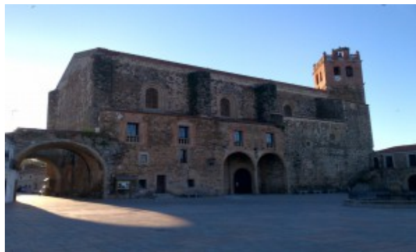
Figura 3. Iglesia Parroquial de Jaraicejo. Fachada meridional.