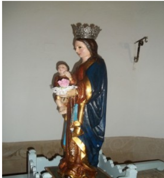
Figura 2. Imagen Nuestra Señora de los Hitos.

La talla de la Virgen de los Hitos es una talla en madera policromada de la Virgen con niño en su mano derecha, sobre peana. La Virgen mira al frente y el niño posee piernas entrecruzadas y su mano izquierda en actitud de bendecir. La Virgen en su mano izquierda posee una flor que en otro tiempo portaba un báculo y a su vez de su mano pende un rosario. Según algunos historiadores, la talla está fechada a finales del siglo XV. [27]