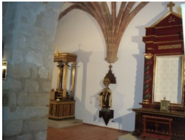
Figura 4. Capillas del lado del Evangelio.