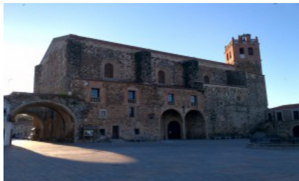
Figura 3. Iglesia Parroquial de Jaraicejo. Fachada meridional.