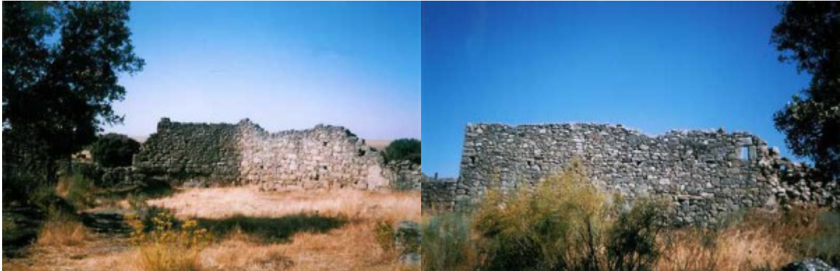
Detalle de la fachada del convento