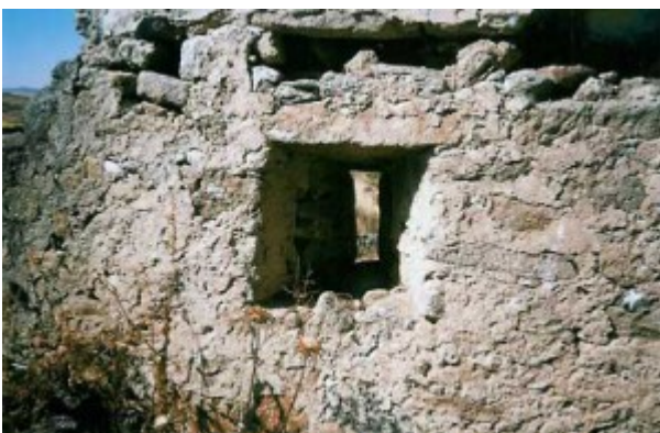
Detalle de una ventana de las celdas del convento