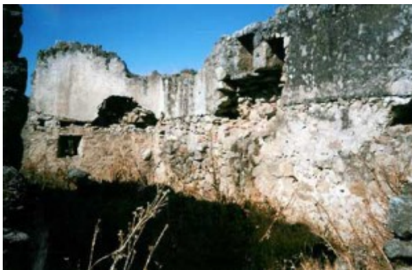
Interior de la iglesia conventual