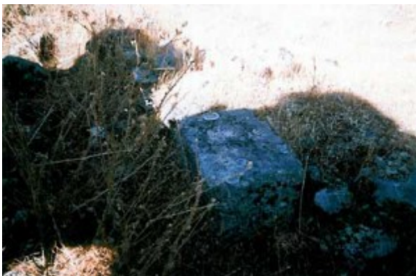
Basa de columna del claustro