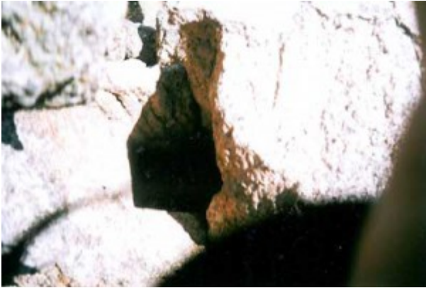
Detalle del orificio para entrada de la tranca de cerramiento