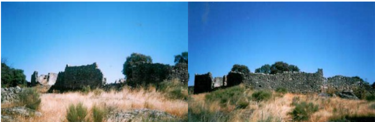
Convento de Trujillo