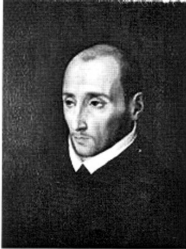
Lám. 1. Retrato de D. Juan de Ribera por Luís de Morales. Museo del Prado.1563.