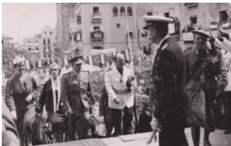
Nº 10: “El Caudillo en Cáceres, entrando en las Casas Consistoriales”