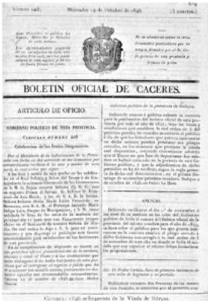
Fig. 4: BO de Cáceres, 14-10-1846, Imprenta de la Viuda de Burgos, 1946.