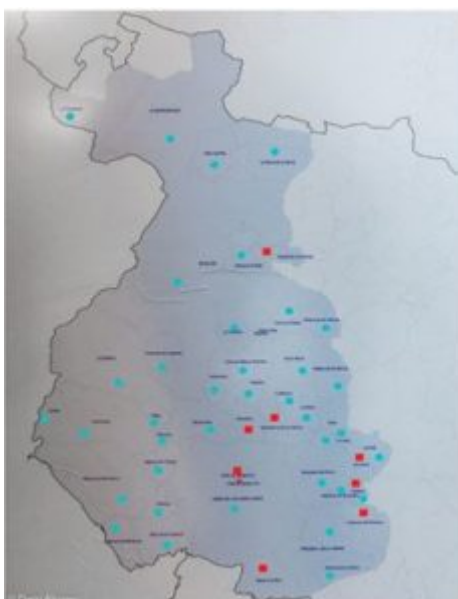
Cuadro 2. Mapa del Obispado de Badajoz antes de 1873

Como podemos observar, los matrimonios entre afines sobresalen en número pues sólo existen nueve localidades en las que priman los matrimonios consanguíneos (Alconera (65), Atalaya (17), Higuera la Real (320), Puebla de la Calzada (54), Salvaleón (195), Salvatierra de los Barros (182), Valencia del Ventoso (195), Valle de Matamoros (86) y Valle de Santa Ana (121)). Sin embargo, en el caso de Atalaya, tiene el mismo número de matrimonios por afinidad y consanguinidad, y como tal, se han señalado en el mapa los dos tipos.