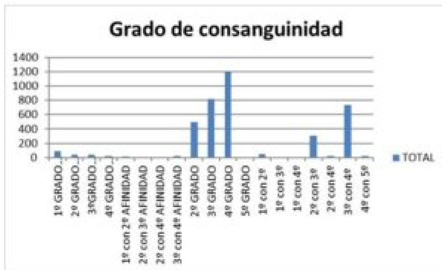
Cuadro 3. Grados de Consanguinidad

Con el Concilio de Trento, los enlaces matrimoniales por consanguinidad fueron regulados con la computación de grados germánica, estableciendo una serie de impedimentos con el fin de que este tipo de enlaces se realizaran con un mínimo de control. A través de la siguiente tabla, podemos observar los grados más frecuentados en el siglo XIX: