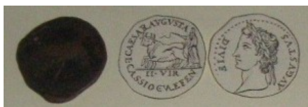
Fig. 7: Bronce con el tipo de la yunta fundacional. Está al revés, a la izquierda está el reverso y a la derecha está el anverso de la moneda.

Era importante también que la moneda exprese que ha sido acuñada con permiso del emperador Augusto. Esto nos indica que la Lusitania era una provincia imperial, esto es, gobernada bajo el mandato directo del emperador, quien designaba directamente a quien debía dirigirla. Eran las provincias más conflictivas, que necesitaban de una mano más dura, mientras que el Senado estaba al cargo de las provincias más tranquilas.