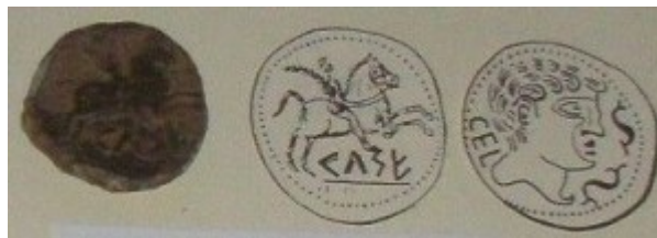
Fig. 1: As con jinete lancero. Está al revés, a la izquierda está el reverso y a la derecha está el anverso de la moneda.

Aquí expondremos unos cuantos ejemplos de moneda hispánica, los más característicos y significativos según el museo, pues los ha juzgado merecedores de unos dibujos adjuntos que nos permitan ver anverso y reverso.