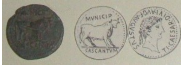
Fig. 9: Bronce con tipo de toro estante. Está al revés, a la izquierda está el reverso y a la derecha está el anverso de la moneda.

importancia como elemento propagandístico.