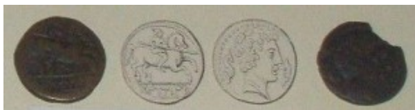
Fig. 4: Bronce con jinete lancero. Está al revés, a la izquierda está el reverso y a la derecha está el anverso de la moneda.

En el reverso nos encontramos con un pez, que más concretamente podemos relacionar con un atún debido a que al principal pez que se pescaba, según el método de almadraba, en la bahía gaditana. Es un tipo muy repetido en las acuñaciones gaditanas y hace referencia a lo que era la principal riqueza y medio de vida de los habitantes de la ciudad, la pesca del atún y su conversión en una salsa denominada garum , que gozó de considerable éxito incluso en época romana. El valor probablemente también sea erróneo, pues dudamos de que sea un semis, proponemos que fuera un shekel fenicio.