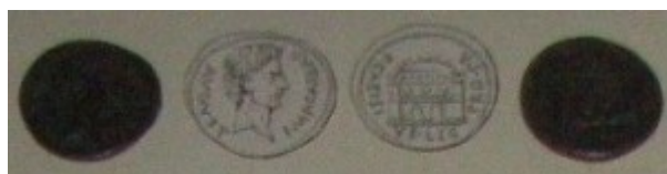
Fig. 13: Famosísima emisión de denarios de plata emeritenses con tipo de las puertas de la

Dado que Osca no es una ciudad fundada para veteranos (como el ejemplo de Emérita Augusta) sino una ciudad de sustrato celtíbero, es dudoso que la V V haga referencia a una legión, sino que lo más probable es que se trate de marcas de control relacionadas de algún modo con la ceca emisora.