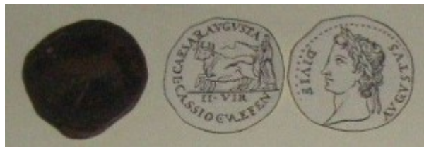
Fig. 7: Bronce con el tipo de la yunta fundacional. Está al revés, a la izquierda está el reverso y a la derecha está el anverso de la moneda.

Era importante también que la moneda exprese que ha sido acuñada con permiso del emperador Augusto. Esto nos indica que la Lusitania era una provincia imperial, esto es, gobernada bajo el mandato directo del emperador, quien designaba directamente a quien debía dirigirla. Eran las provincias más conflictivas, que necesitaban de una mano más dura, mientras que el Senado estaba al cargo de las provincias más tranquilas.