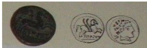
Fig. 2: As con pegaso volando. Está al revés, a la izquierda está el reverso y a la derecha está el anverso de la moneda.

Melqart, Apolo-Melqart. De nuevo hay que decir que el museo no propone cronología alguna para esta moneda, pero es fácil advertir que dado que la ceca de Kelse sólo emitió moneda entre mediados del siglo II a. C. a mediados del siglo I a. C. es la única cronología posible de la moneda.