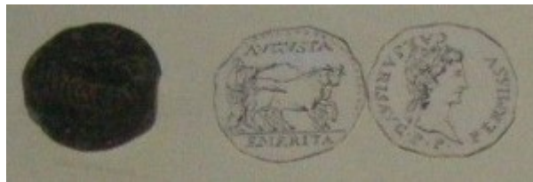
Fig. 6: Bronce con tipo de yunta fundacional. Está al revés, a la izquierda está el reverso y a la derecha está el anverso de la moneda.

La investigación de la ceca, en el caso de la ceca de Cartago Nova, reviste grandes problemas, pues como hemos visto, el nombre explícito de la ciudad jamás aparece en moneda alguna y aparecen las siglas, en su lugar, C·V·I·N o C·V·I·N·C.