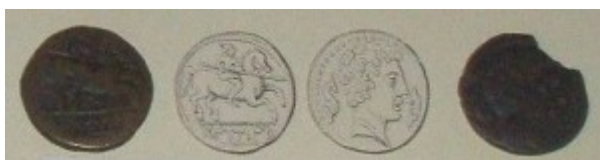
Fig. 4: Bronce con jinete lancero. Está al revés, a la izquierda está el reverso y a la derecha está el anverso de la moneda.

En el reverso nos encontramos con un pez, que más concretamente podemos relacionar con un atún debido a que al principal pez que se pescaba, según el método de almadraba, en la bahía gaditana. Es un tipo muy repetido en las acuñaciones gaditanas y hace referencia a lo que era la principal riqueza y medio de vida de los habitantes de la ciudad, la pesca del atún y su conversión en una salsa denominada garum , que gozó de considerable éxito incluso en época romana. El valor probablemente también sea erróneo, pues dudamos de que sea un semis, proponemos que fuera un shekel fenicio.