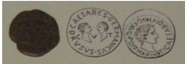
Fig. 10: Bronce con tipo de los herederos del Imperio. Está al revés, a la izquierda está el reverso y a la derecha está el anverso de la moneda.

exponen en la misma vitrina, que captan una mayor atención de los visitantes.