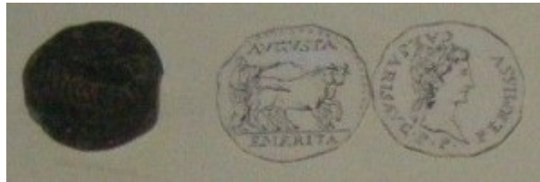
Fig. 6: Bronce con tipo de yunta fundacional. Está al revés, a la izquierda está el reverso y a la derecha está el anverso de la moneda.

La investigación de la ceca, en el caso de la ceca de Cartago Nova, reviste grandes problemas, pues como hemos visto, el nombre explícito de la ciudad jamás aparece en moneda alguna y aparecen las siglas, en su lugar, C·V·I·N o C·V·I·N·C.