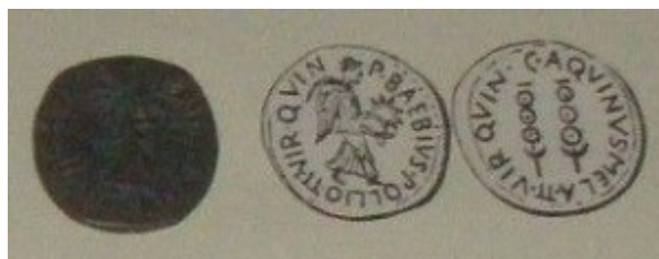
Fig. 5: Bronce con Victoria y estandartes legionarios. Está al revés, a la izquierda está el reverso y a la derecha está el anverso de la moneda.