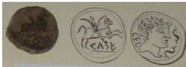
Fig. 1: As con jinete lancero. Está al revés, a la izquierda está el reverso y a la derecha está el anverso de la moneda.

Aquí expondremos unos cuantos ejemplos de moneda hispánica, los más característicos y significativos según el museo, pues los ha juzgado merecedores de unos dibujos adjuntos que nos permitan ver anverso y reverso.