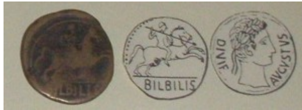
Fig. 11: Bronce con tipo de jinete lancero. Está al revés, a la izquierda está el reverso y a la derecha está el anverso de la moneda.