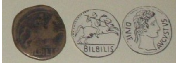
Fig. 11: Bronce con tipo de jinete lancero. Está al revés, a la izquierda está el reverso y a la derecha está el anverso de la moneda.