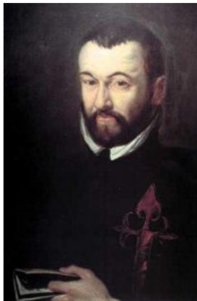
Fig 1. Benito Arias Montano

Bajo el reinado de Felipe II figuran el escritor franciscano Antonio de Santa María; el traductor brocense, Benito Arias Montano. Durante el reinado de Felipe III, el filósofo y políglota Pedro de Valencia; el cronista y gramático Gonzalo de Correas y finalmente, el médico Juan de Sorapán. Sobresalieron en otros ámbitos de igual manera, pero estas son sus profesiones más conocidas. Algunos tienen instituciones culturales en su nombre actualmente.