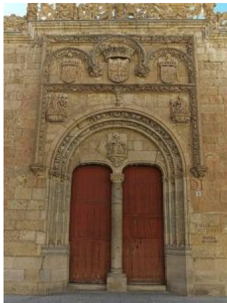
Fig 4. Hospital del Estudio

Su fachada da al Patio de Escuelas, en su lienzo sur, hasta lindar con la entrada al edificio de las Escuelas Menores, y calle Libreros