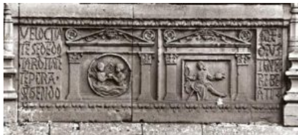
Fig 2. Enigma del claustro de la Universidad de Salamanca

desde 1415 fue Alonso Rodríguez. Es de estilo tardogótico y renacentista por lo prolongado de su obra, con decoración plateresca. Se ubica en la calle librerías 19. Los materiales utilizados son piedra cortada en sillares y en el exterior piedra franca de Villamayor. Es patrimonio protegido mediante la declaración BIC (Bien de interés cultural) desde el 3 de junio de 1931. En las Escuelas Mayores se estudiaba para los grados de Licenciado y Doctor, títulos mayores. El antipapa Benedicto XIII fue un mecenas de la universidad, apoyó la compra de los solares, en 1411 ordenó edificar las Escuelas Mayores (llamado edificio histórico de la universidad). Existió una rivalidad entre el maestro de obras de la catedral nueva que se estaba edificando y entre el rector y el decano de la universidad por la altura de cada edificio. El cabildo catedralicio acusó a la fábrica de obras de la universidad de querer hacer un edificio civil tan alto como un edificio religioso. La institución universitaria, en ocasiones, tuvo conflictos con la vecina jerarquía diocesana.