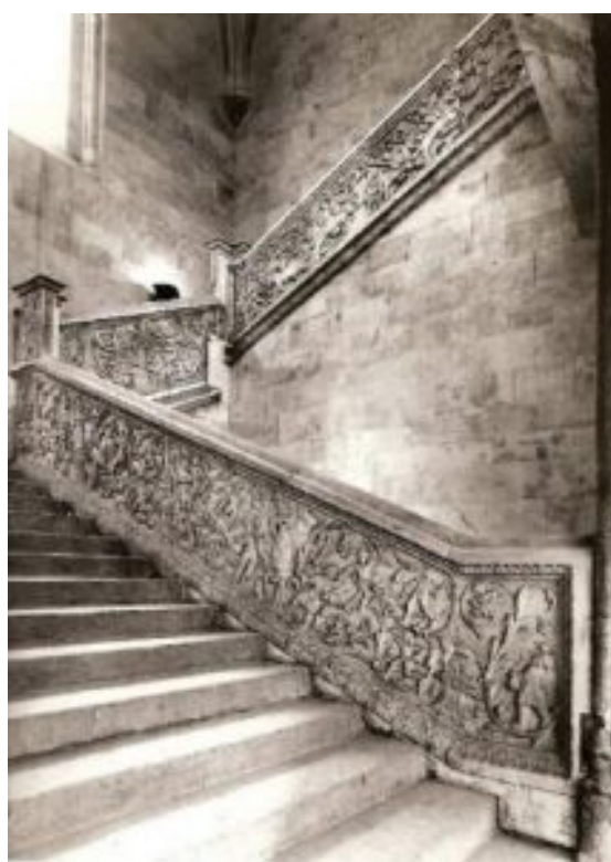
Fig 6. Universidad de Salamanca. La escalera y su programa iconológico

Es una de las escaleras renacentistas más notables del país. La Escalera del Conocimiento fue la primera de España (la de Palencia no logró ese grado pues quedó en Estudio General). Es un elemento arquitectónico con una ornamentación dirigida a los estudiantes. La escalera tiene dos funciones: la práctica, unir el piso bajo con el superior y la intelectual: aleccionar al público. Esta pieza arquitectónica conecta el claustro bajo con el alto, dos de los más relevantes de España, además conduce a la biblioteca de la universidad, o sea, al conocimiento. La universidad aprovechaba cada elemento de su patrimonio para enseñar. El