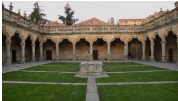
Fig 3. Universidad de Salamanca. Patio de las Escuelas Menores

Ejecutado en 1428, el edificio actual es de 1532. La fachada es de 1533, de Pedro Chacón en estilo plateresco. Localizado en el patio escuelas nº 1.