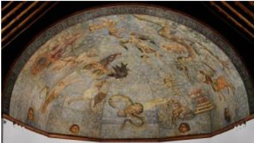
Fig 5. Universidad de Salamanca. Cielo de la Biblioteca

cultural que impulsaba la institución educativa.