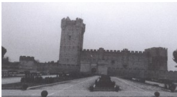
Imagen 1: Castillo de la Mota en Medina del Campo.

Almagro[5]. El fiscal Villalobos procedió contra él con los cargos de asesinato de un gobernador Real, de negligencia en la acción contra los indios y de fraudes, robos y desfalcos a la hacienda pública[6].