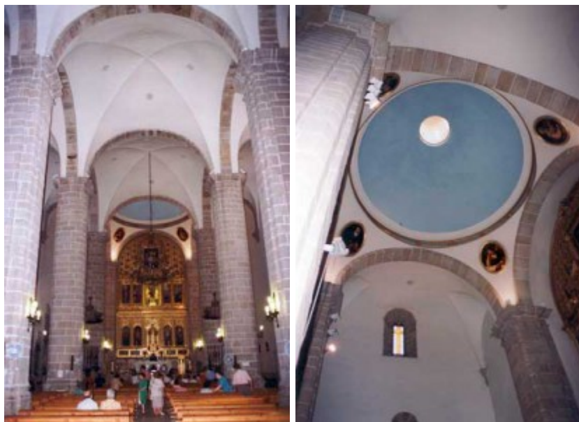
Figs. 1 y 2. Nave y capilla mayor de la iglesia de la Asunción de Villanueva de la Serena

Para el mes de mayo de 1752 estaba contratado con el maestro de Don Benito, Francisco Díaz [14] , el desarrollo de una costosa intervención acordada en un principio en 102.946 reales, aunque se incrementaría de modo ostensible a lo largo de los años, influyendo significativamente dentro de la estructura de todo el conjunto. Ignoramos en que consistían, aunque la mención de «obra de nueva iglesia» o «de reedificación» infiere el carácter de la misma [15] .