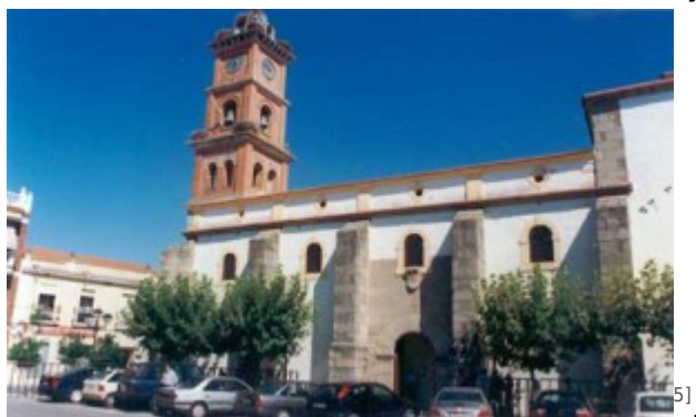
Fig.3. Iglesia parroquial de Ntra. Sra. de la Asunción de Quintana. Fachada del mediodía