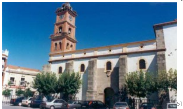
Fig.3. Iglesia parroquial de Ntra. Sra. de la Asunción de Quintana. Fachada del mediodía