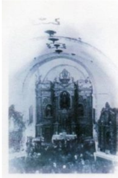
Fot 1. Retablo y altar de la iglesia de Santa María de Aguas Vivas, Hervás (Cáceres)