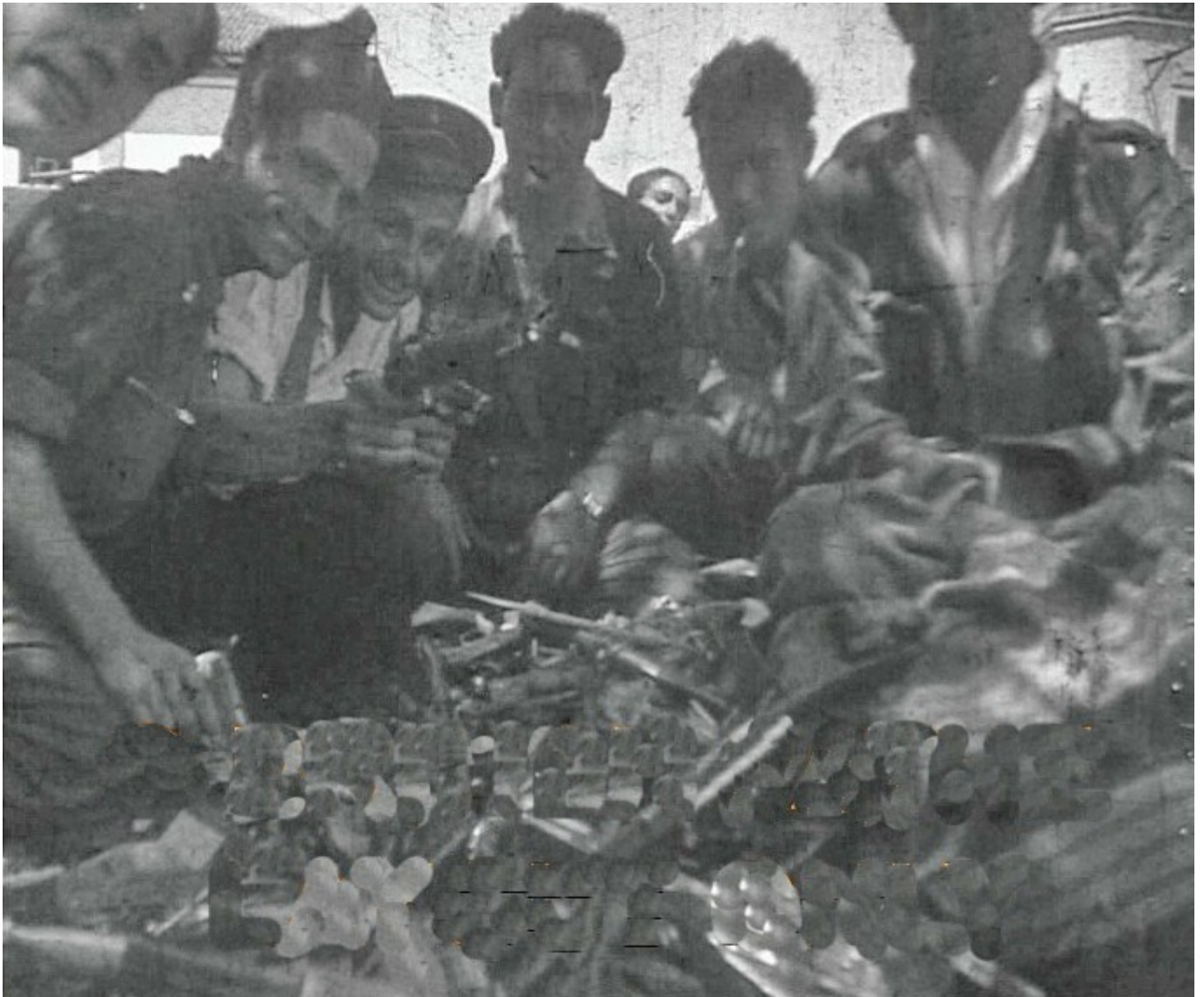
Figura 14. Badajoz. 17 de agosto de 1936. Un policía, un legionario guardias cívicos y civiles posan con las armas recogidas junto al colegio General Navarro.