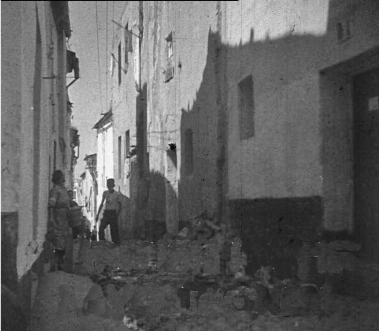
Figura 17. Badajoz. 17 de agosto de 1936. Detalles de los bombardeos en una calle de la capital