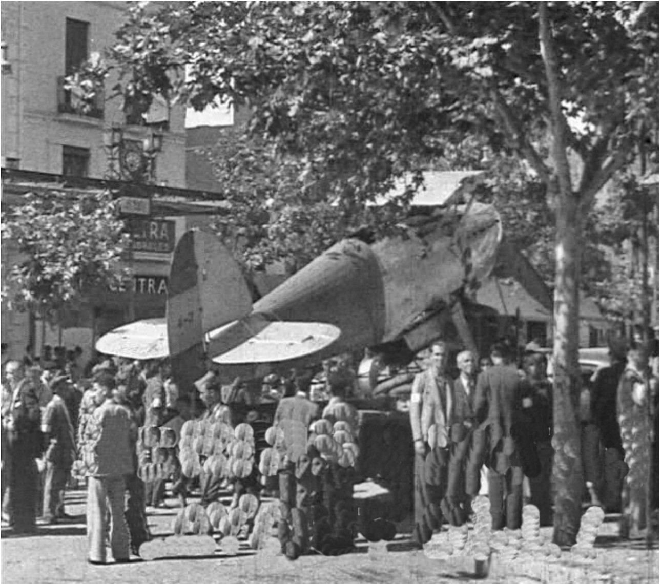
Figura 24. Badajoz. 17 de agosto de 1936. Exhibición en la Plaza de la República de una avioneta Hawker Fury (matrícula 4-2)