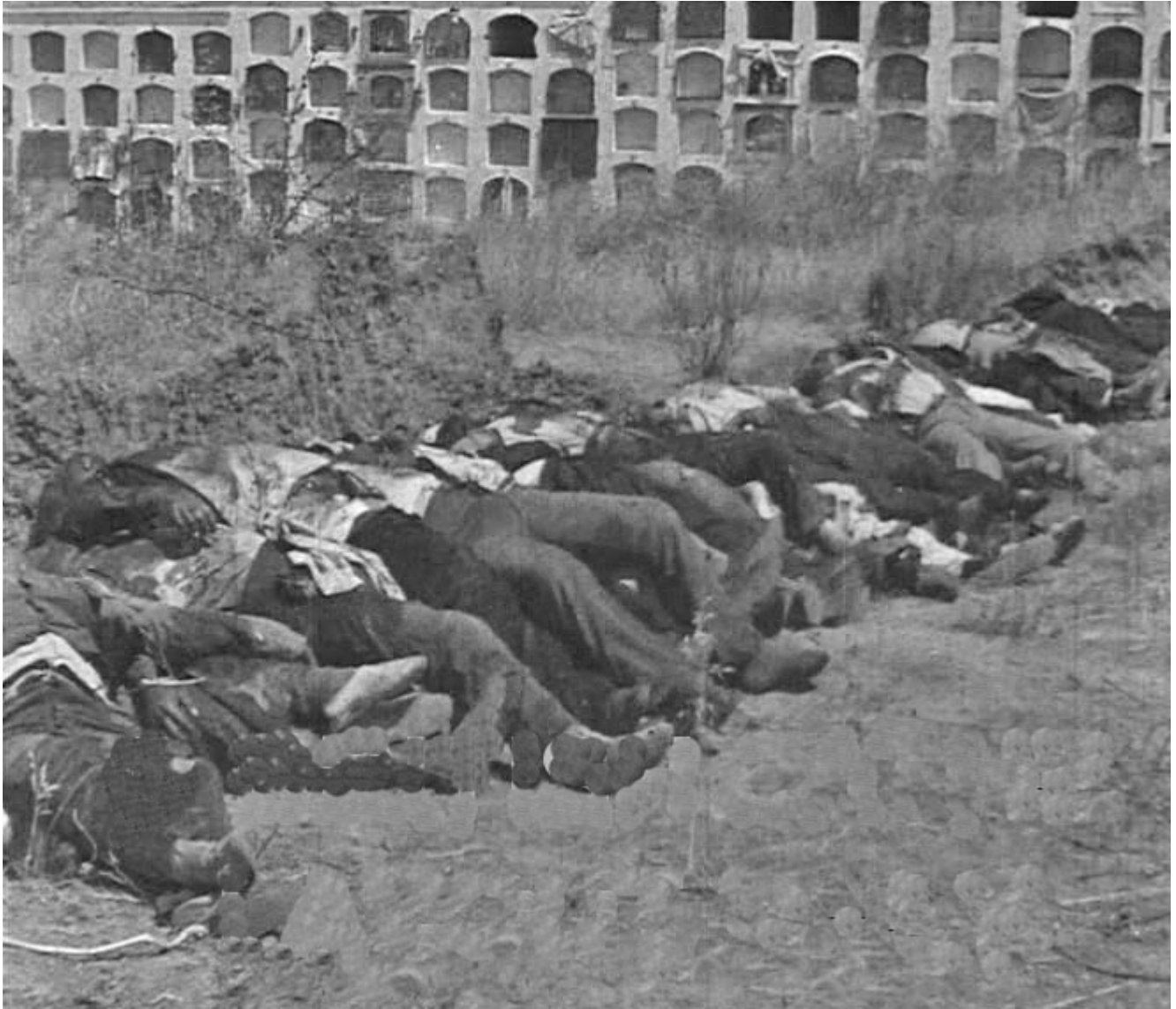
Figura 28. Cementerio de San Juan de Badajoz. 18 de agosto de 1936. Cadáveres de fusilados y muertos en los combates