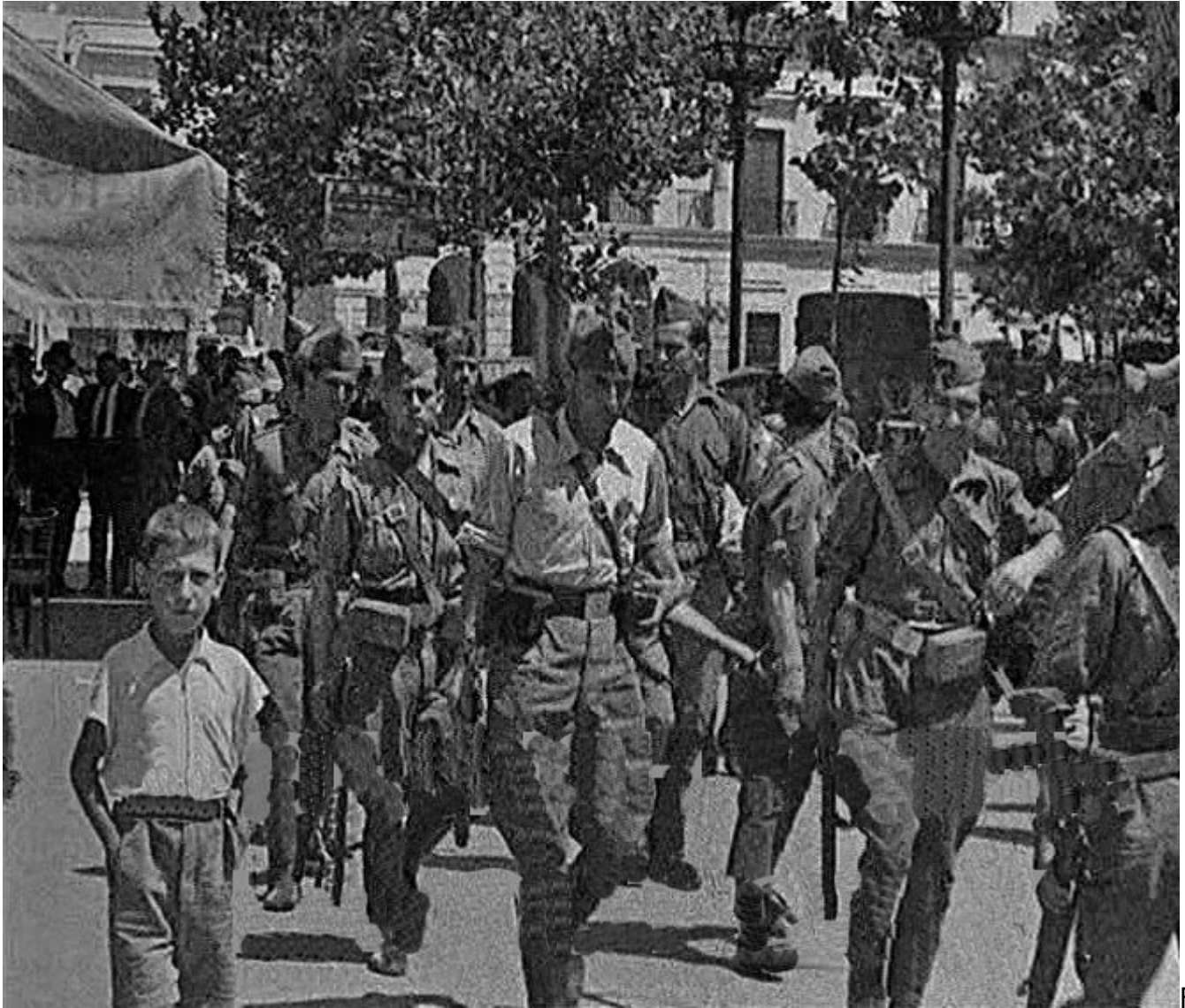
Figura 20. Badajoz. 17 de agosto de 1936. Un grupo de legionarios marcha por la Plaza de la República. Al fondo se aprecia la fachada del Ayuntamiento