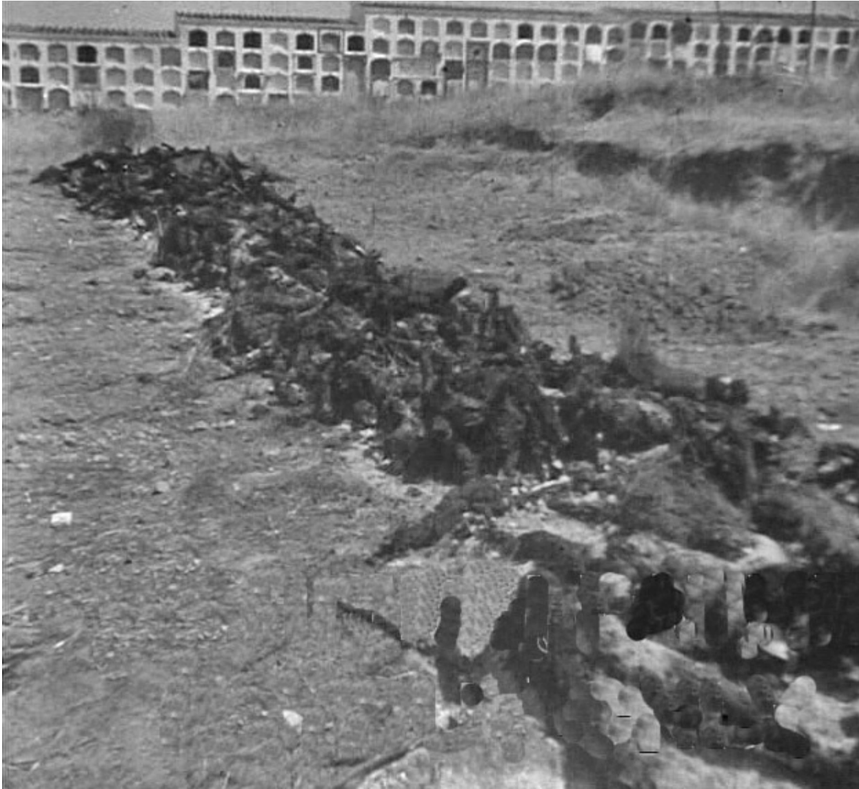
Figura 29. Cementerio de San Juan de Badajoz. 18 de agosto de 1936. Cadáveres de fusilados y muertos en los combates de la ciudad incinerados