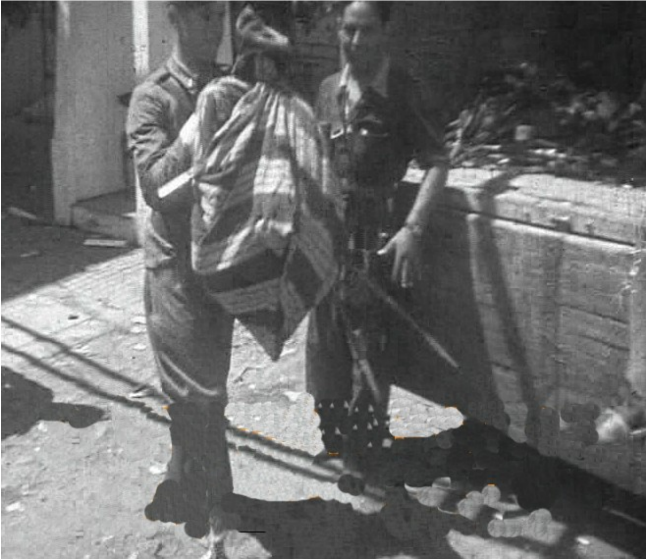
Figura 13. Badajoz. 17 de agosto de 1936. Detalle de la recogida de armas junto al colegio General Navarro.