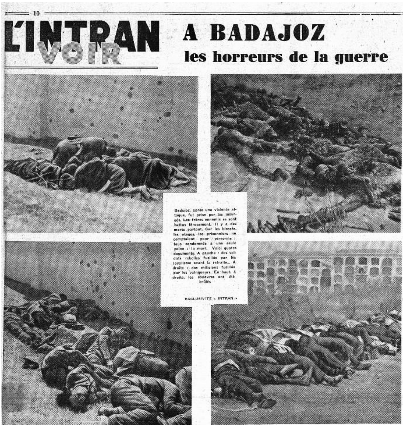
Figura 36. L'Intransigeant (París), 29 de agosto de 1936. La difusión de estas imágenes del cementerio de Badajoz alertaron a las autoridades militares de España y fue el origen de la detención y posterior expulsión de René Brut del territorio nacional