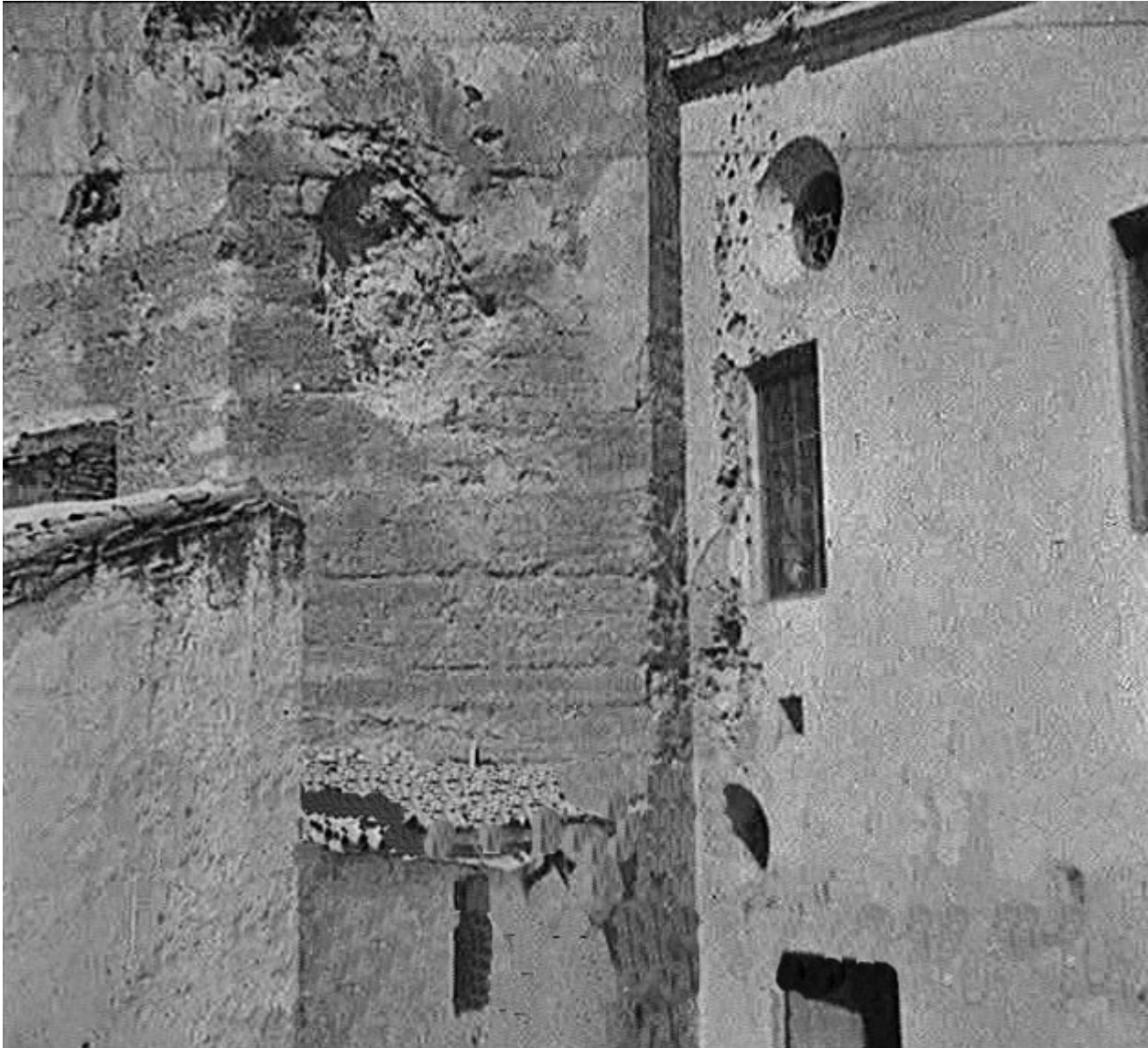
Figura 27. Badajoz. 17 de agosto de 1936. Impacto de varias bombas en la pared de la Torre de Espantaperros