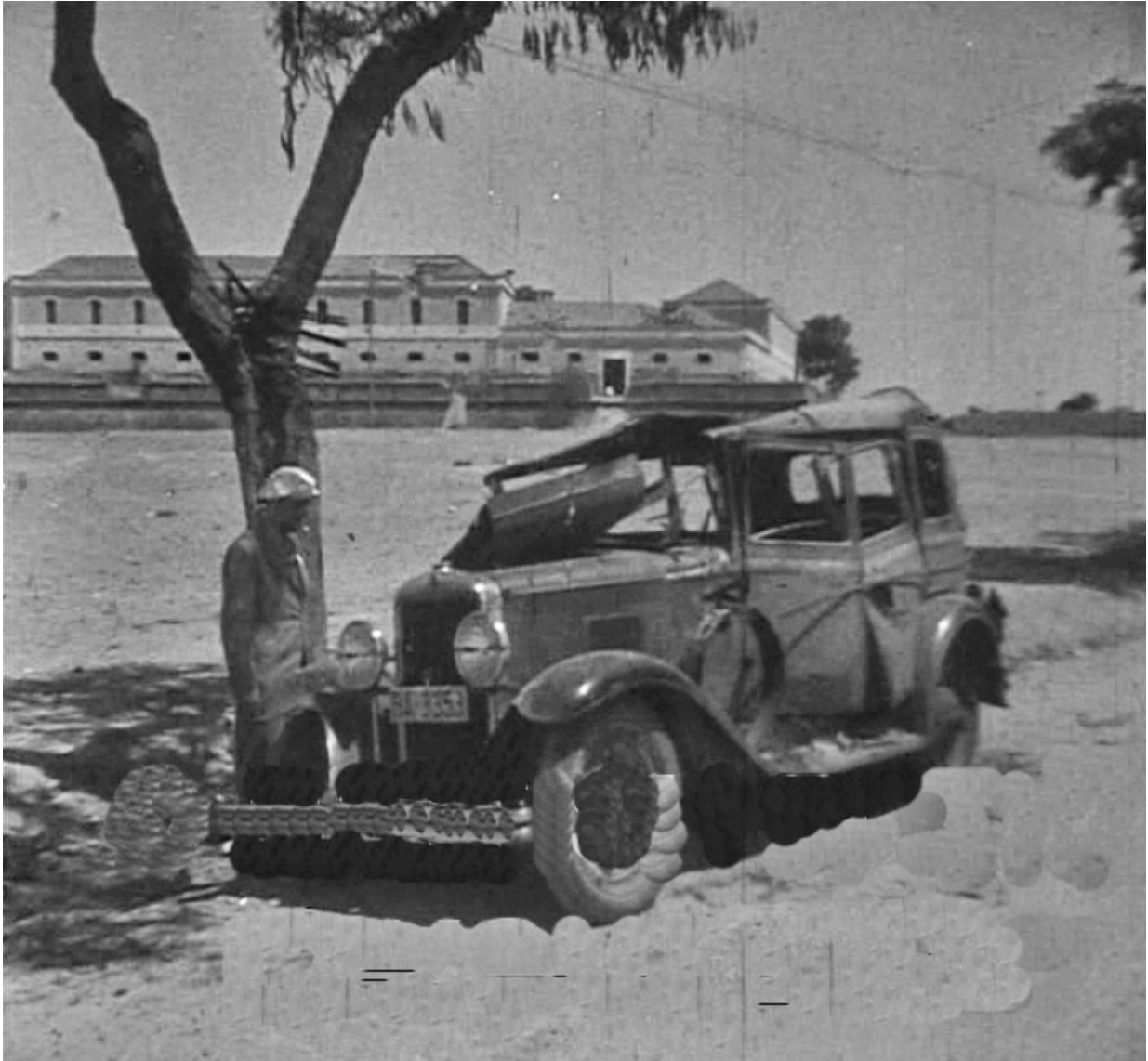
Figura 10. 17 de agosto de 1936. Entrada de Badajoz por la carretera de circunvalación. Un vehículo matrícula BA 3353 y al fondo el Cuartel de La Bomba