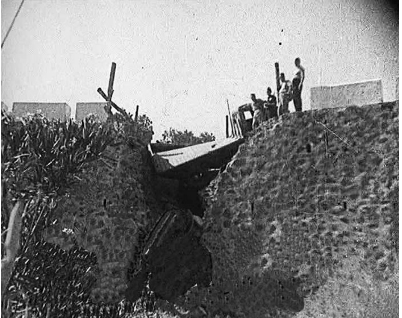
Figura 2. El Ronquillo (Sevilla). Mañana del 16 de agosto de 1936. Detalle de la alcantarilla volada en la carretera de Sevilla a Badajoz