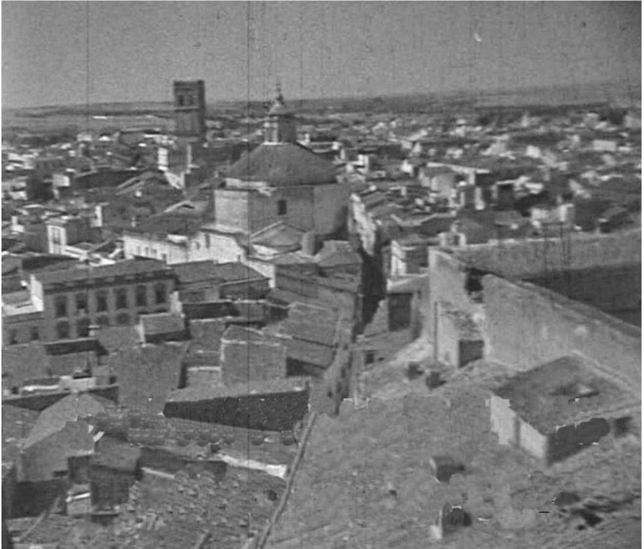
Figura 26. Badajoz. 17 de agosto de 1936. Vista de la ciudad desde la Torre de Espantaperros. En un primer término el cimborrio de la Parroquia de la Concepción, y detrás el campanario de la catedral