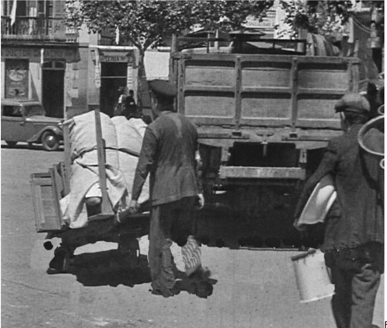
Figura 18. Badajoz. 17 de agosto de 1936. Dos obreros transportan enseres domésticos en la Plaza de la República