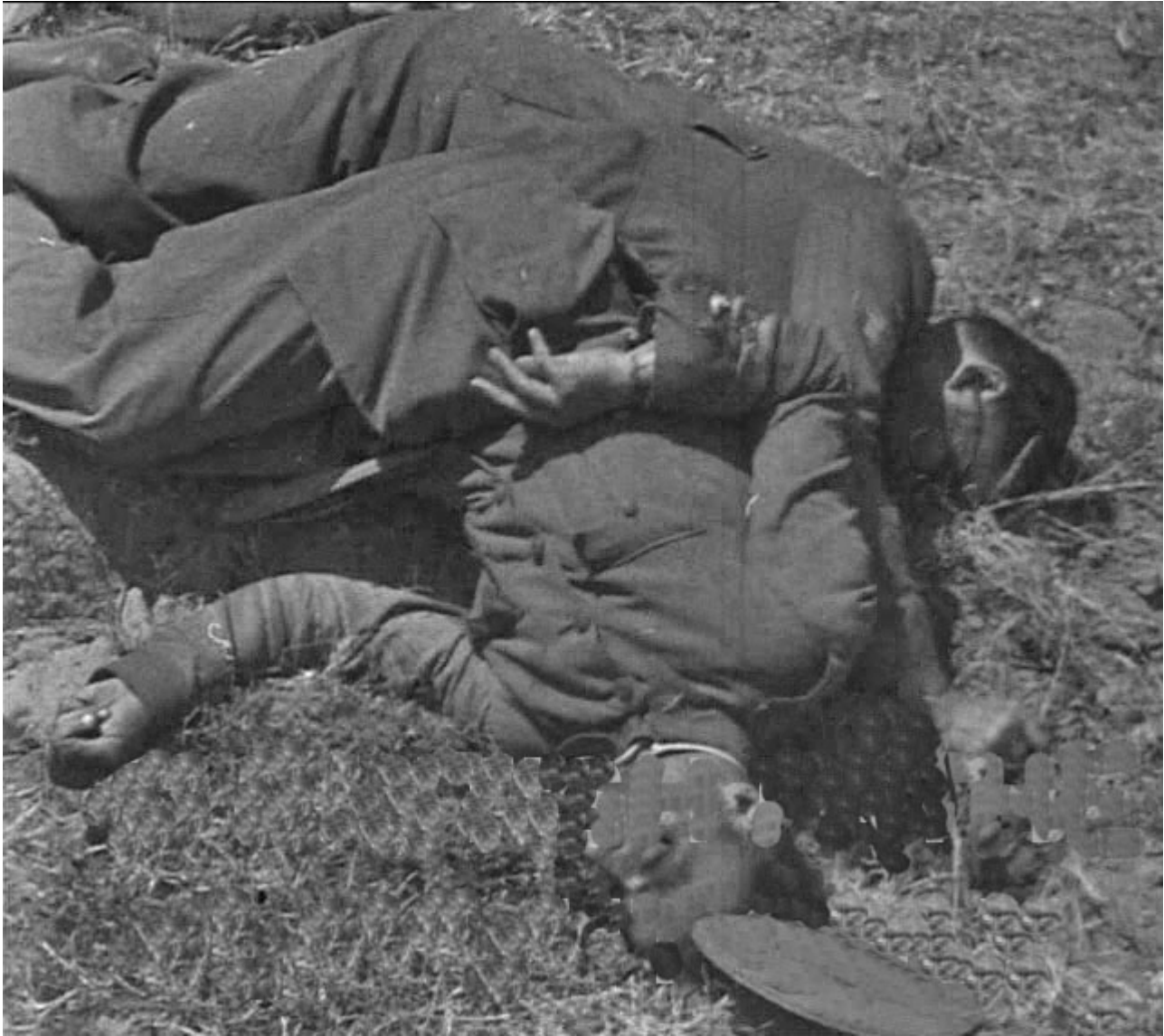
Figura 31. Cementerio de San Juan de Badajoz. 18 de agosto de 1936. Detalle de unos carabinero fusilados