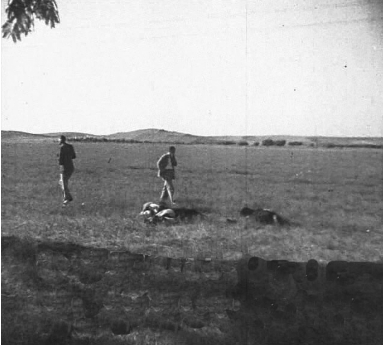
Figura 6. 17 de agosto de 1936. Entrada de Badajoz por la carretera de circunvalación. Tres cadáveres junto a la carretera