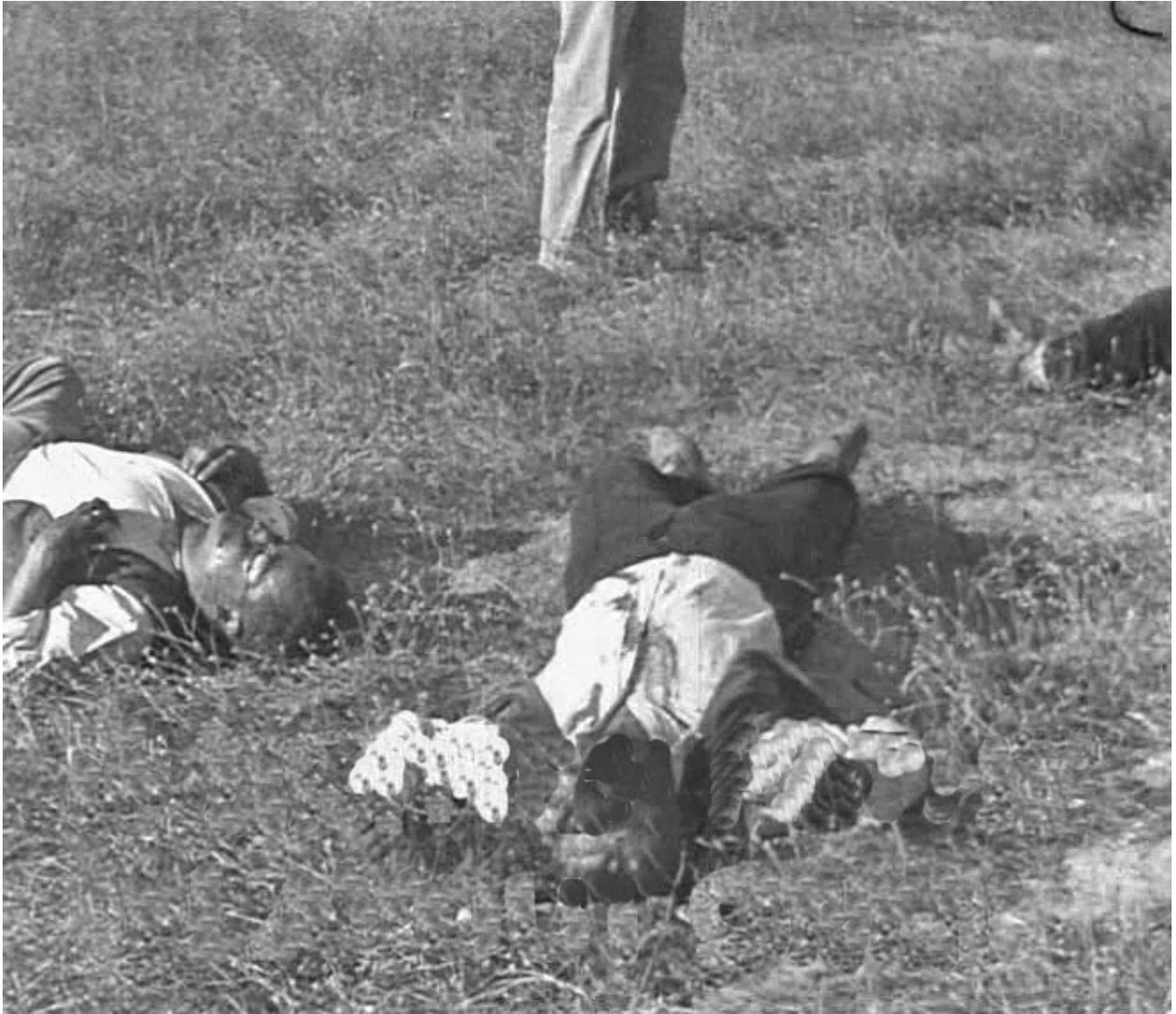
Figura 7. 17 de agosto de 1936. Entrada de Badajoz por la carretera de circunvalación. Detalle de los tres cadáveres junto a la carretera