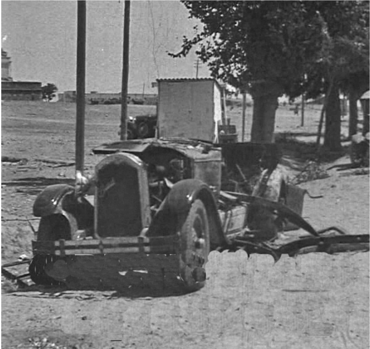
Figura 9. 17 de agosto de 1936. Entrada de Badajoz por la carretera de circunvalación. Detalle del vehículo marca Buick y matrícula BA 2013 (al fondo el Cuartel de La Bomba)