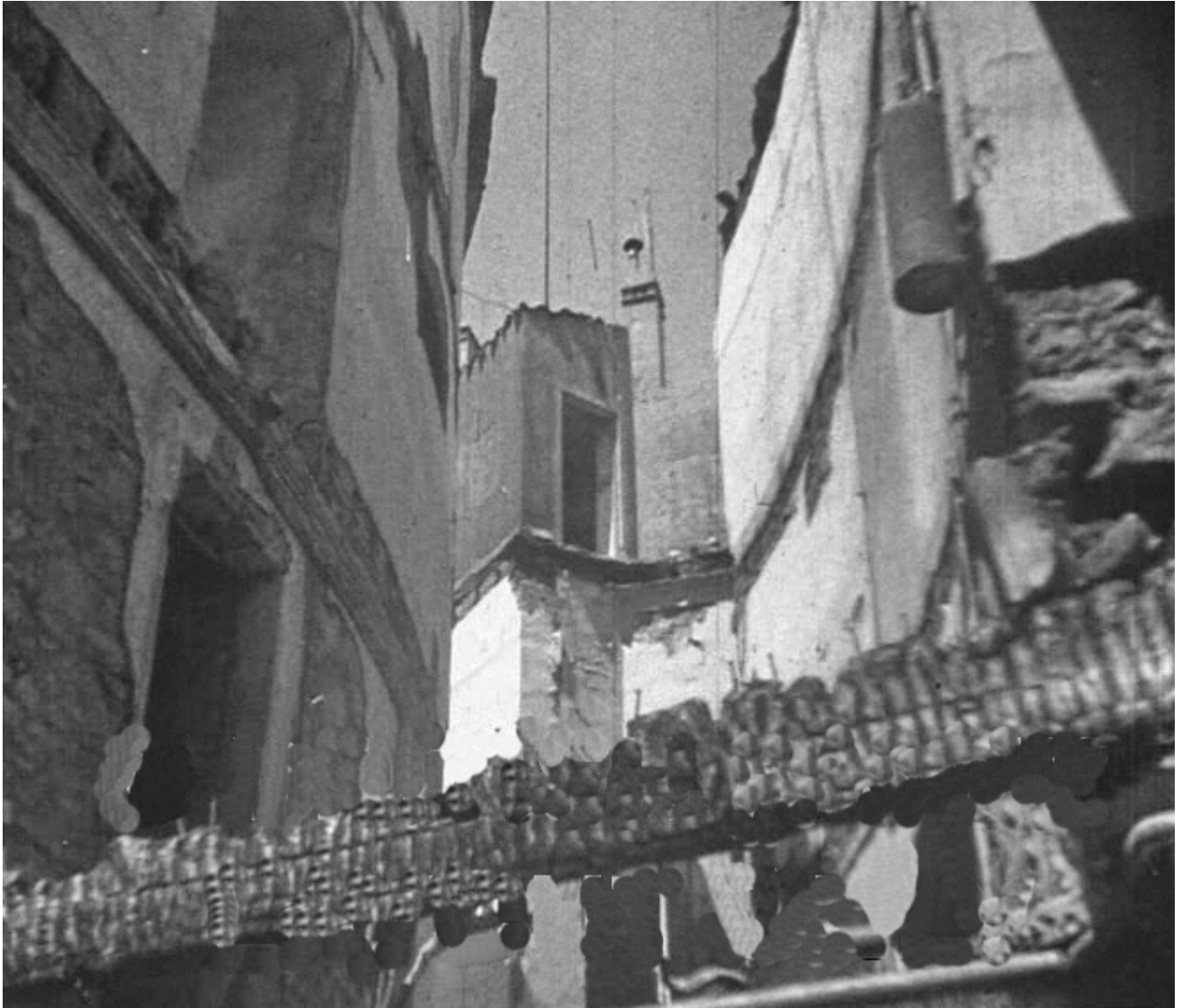
Figura 16. Badajoz. 17 de agosto de 1936. Detalles de las ruinas del Teatro de la Plaza de Minayo.