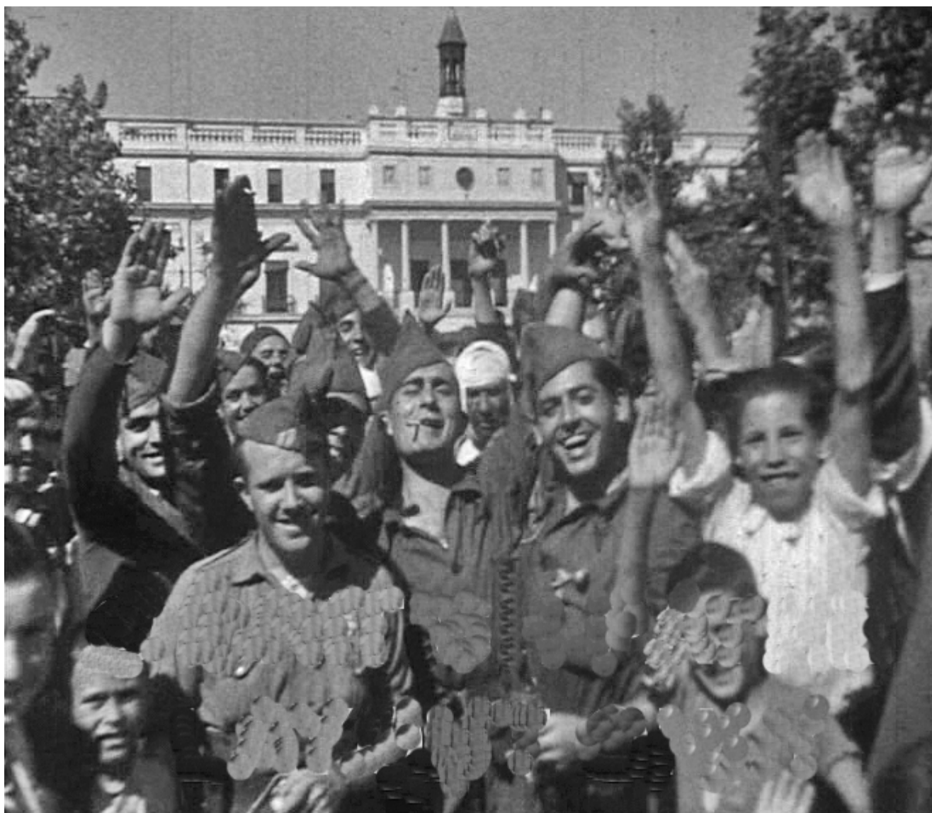
Figura 22. Badajoz. 17 de agosto de 1936. Detalle de un grupo de Legionarios y niños que posan ante la cámara de Brut en la Plaza de la República. Detrás se aprecia la fachada del Ayuntamiento