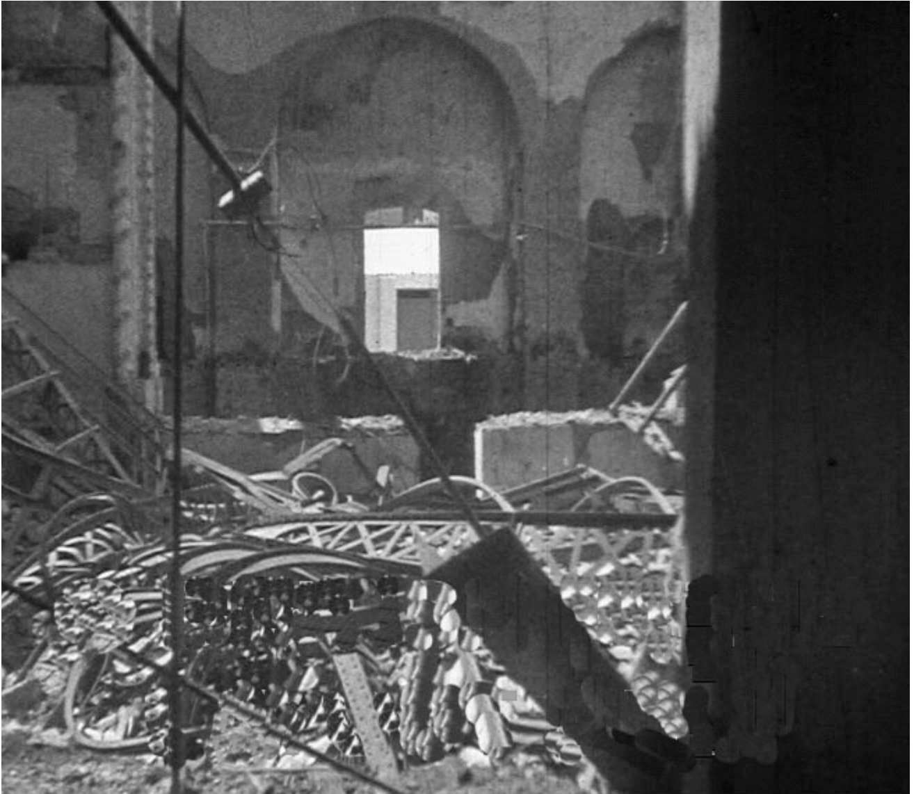
Figura 15. Badajoz. 17 de agosto de 1936. Detalles de las ruinas del Teatro de la Plaza de Minayo.