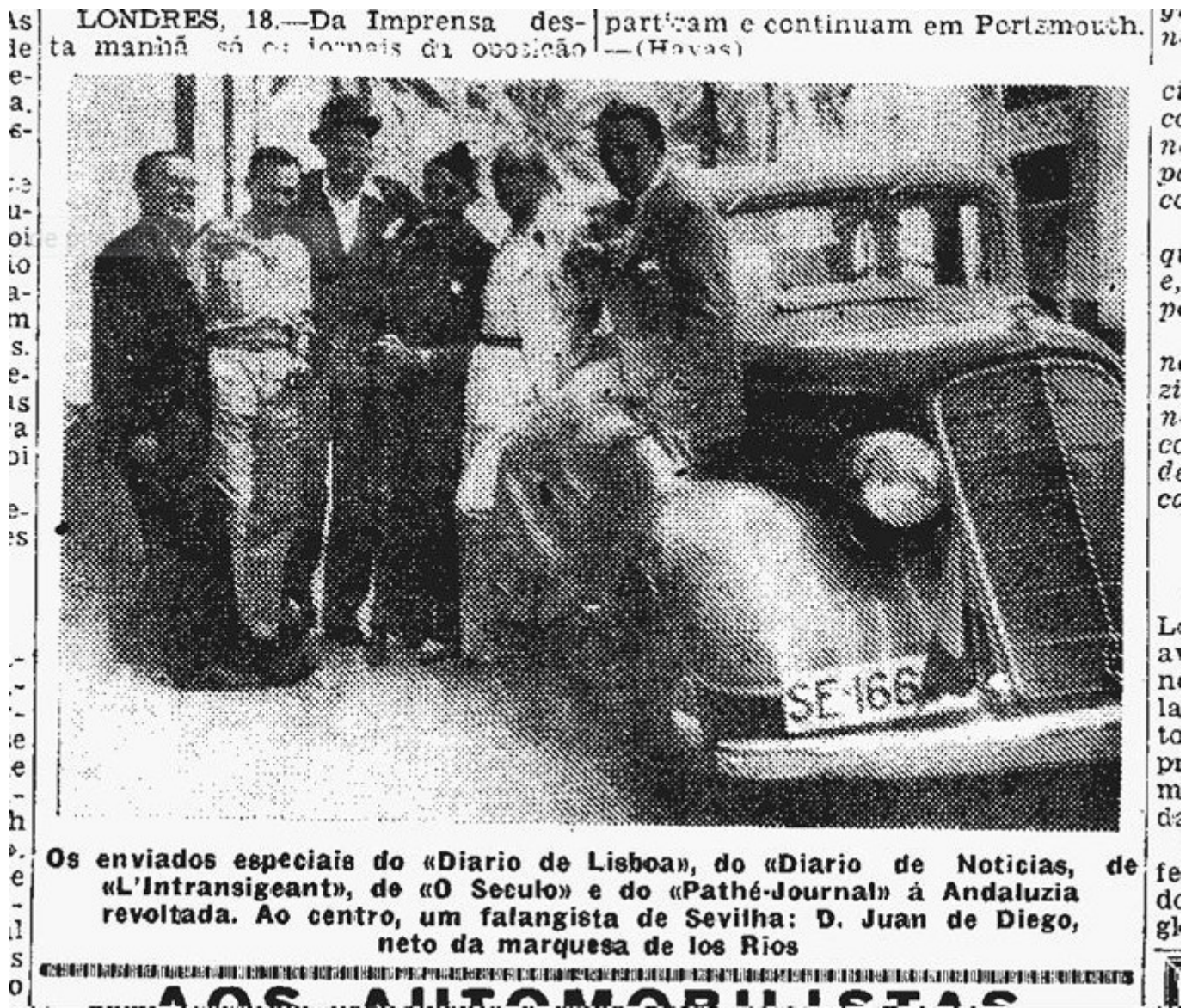
Figura 35. L'Intransigeant (París), 26 de agosto de 1936. Imágenes tomadas en las cercanías de El Ronquillo (Sevilla) en la mañana del 16 de agosto de 1936. Se aprecia en la imagen de la derecha el camión