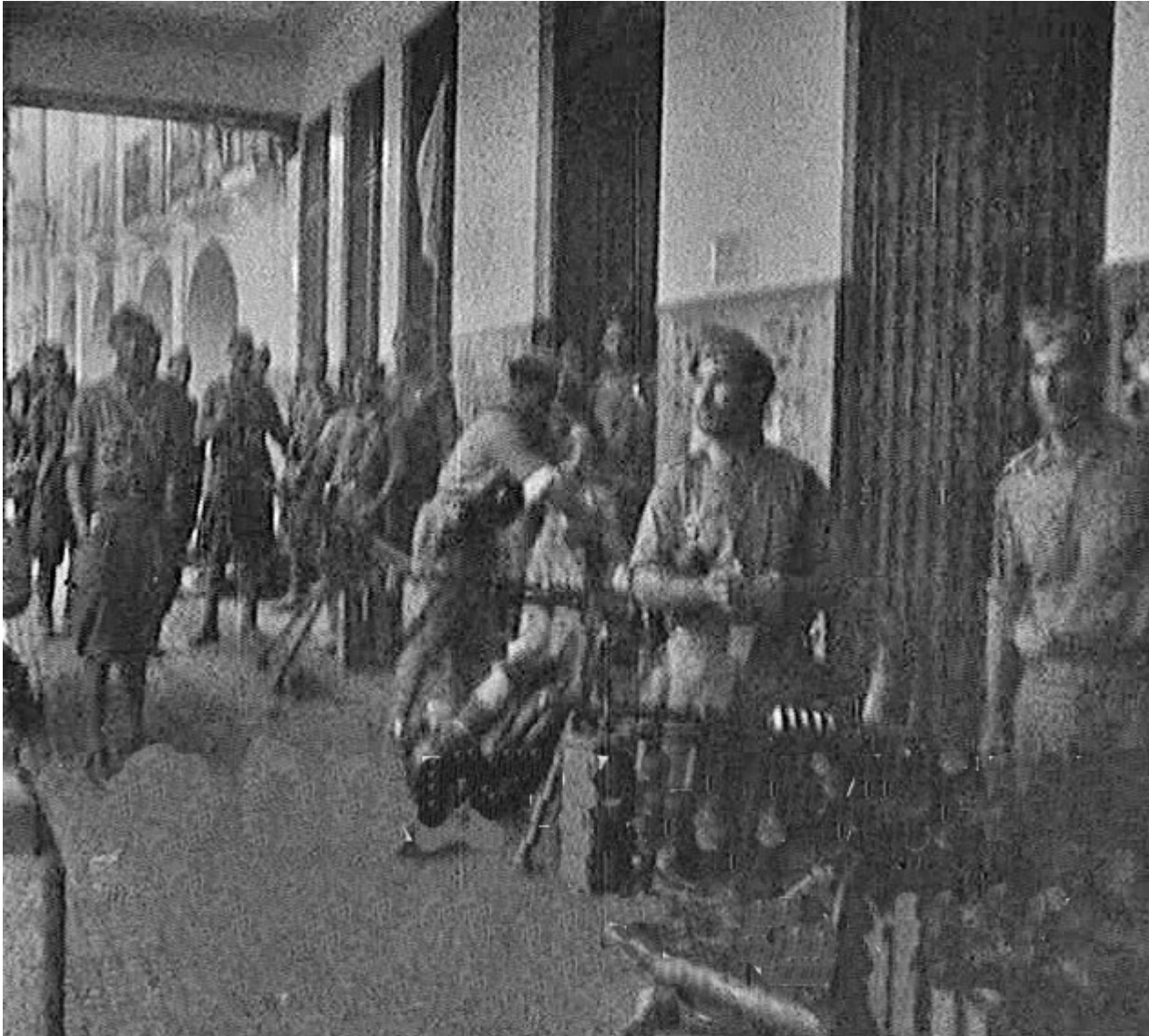
Figura 4. Mérida. Atardecer del 16 de agosto de 1936. Legionarios vivaqueando en los soportales del Palacio de la China, en la Plaza de España de Mérida