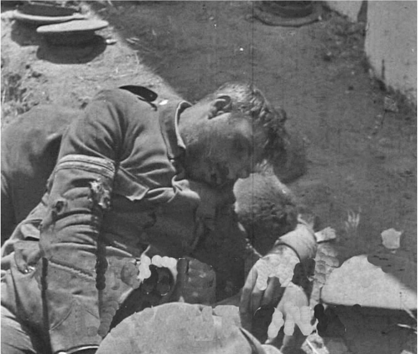
Figura 32. Cementerio (viejo) de Badajoz. 18 de agosto de 1936. Detalle de un guardia civil fusilado en la tapias del camposanto