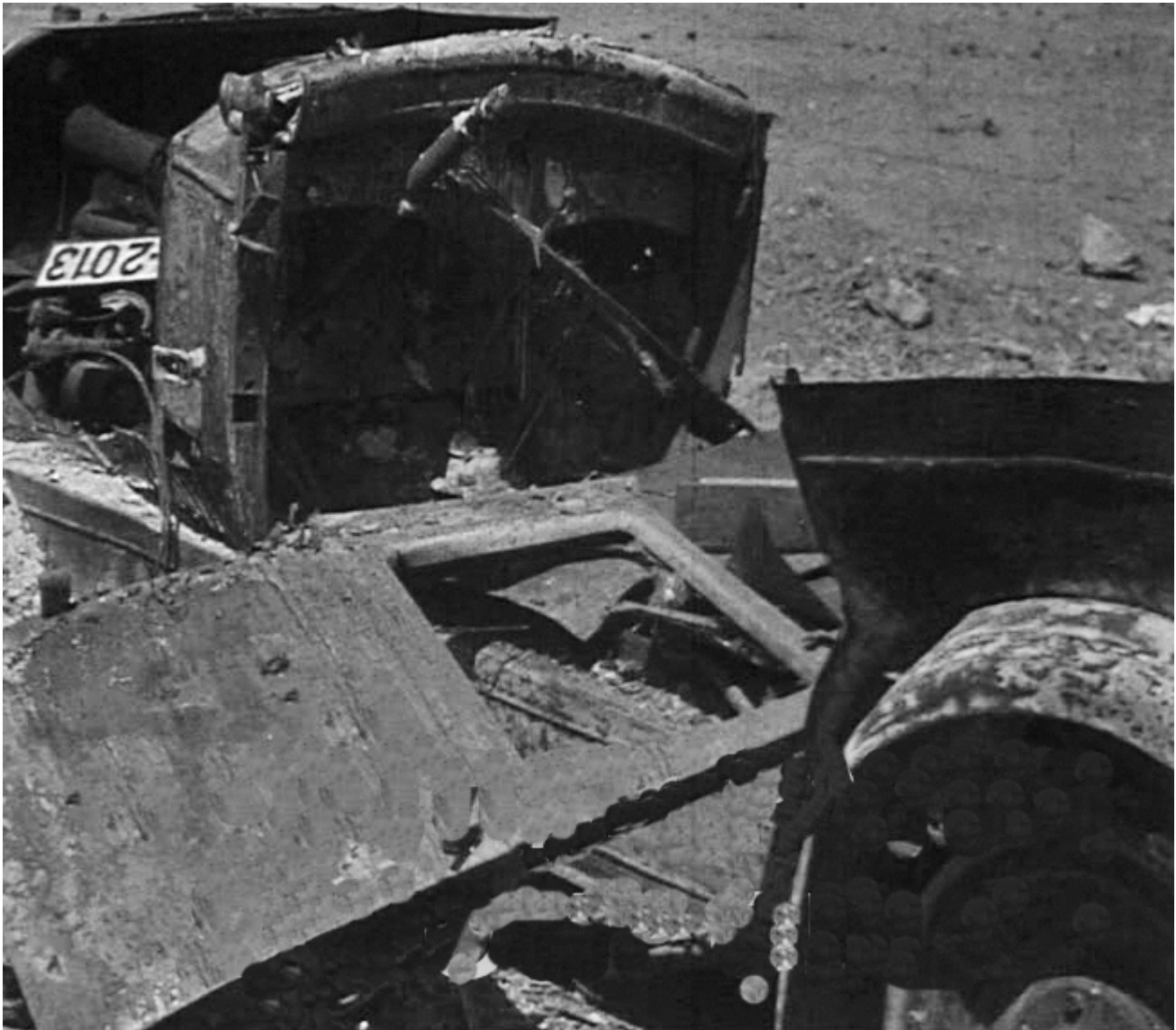
Figura 11. 17 de agosto de 1936. Entrada de Badajoz por la carretera de circunvalación. Detalle del amasijo del vehículo marca Buick y matrícula BA 2013