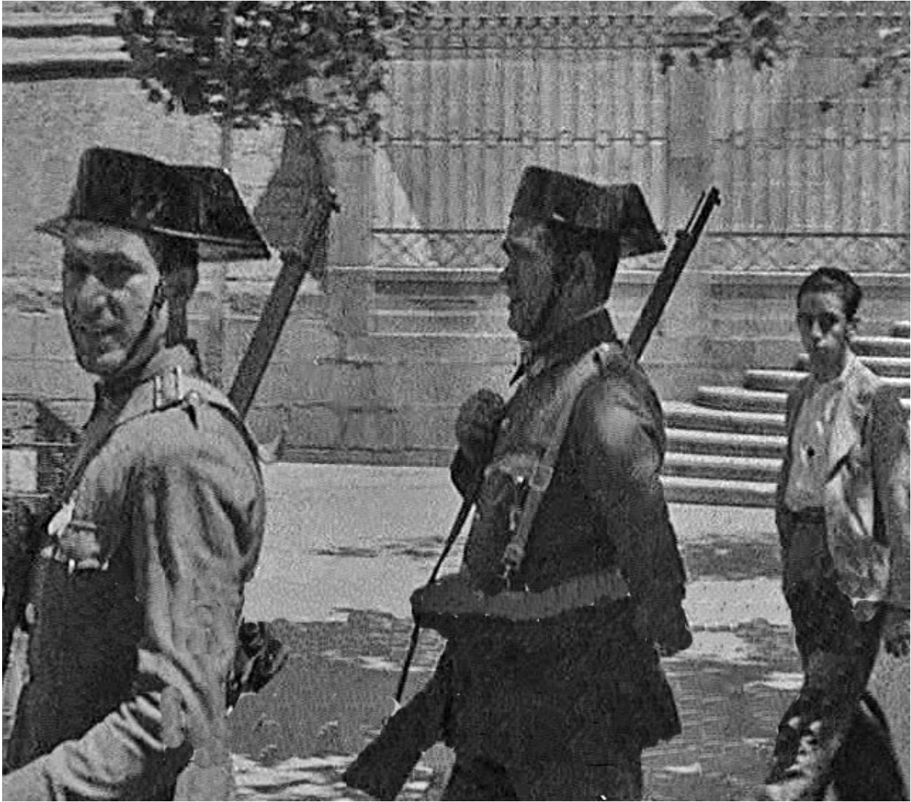
Figura 19. Badajoz. 17 de agosto de 1936. Dos guardias civiles pasean junto a la Catedral de San Juan, en la Plaza de la República