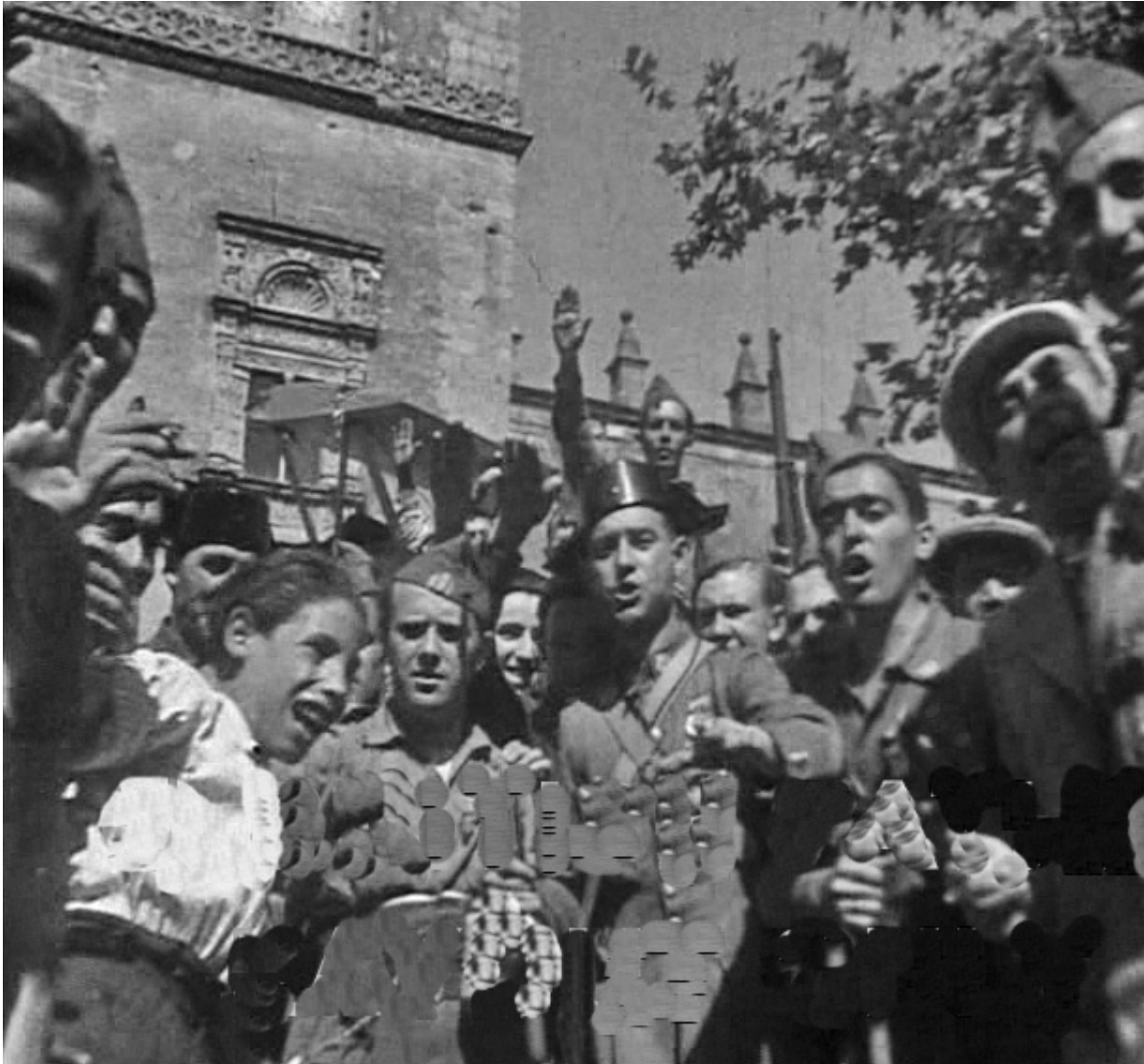
Figura 23. Badajoz. 17 de agosto de 1936. Un grupo de curiosos entre los que hay legionarios, guardias civiles, ciudadanos y niños posan ante el Hawker Fury junto a la Catedral de San Juan