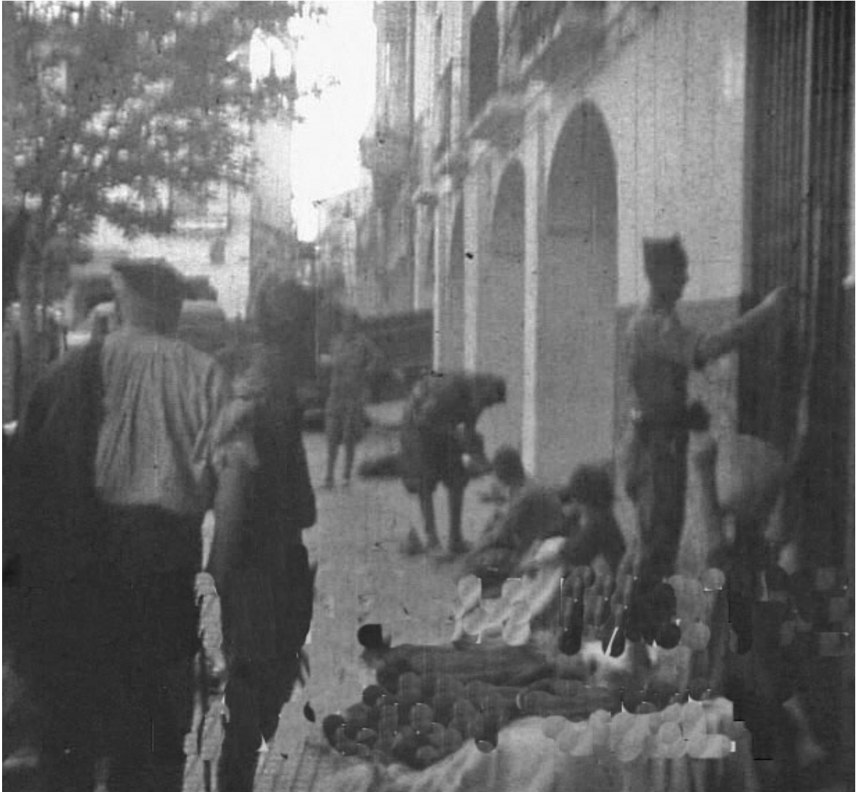
Figura 5. Mérida. Atardecer del 16 de agosto de 1936. Legionarios junto a los soportales del Palacio de la China, en Mérida