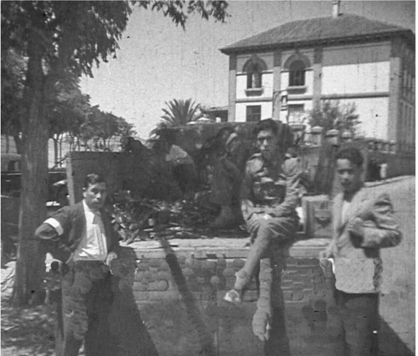
Figura 12. Badajoz. 17 de agosto de 1936. Recogida de armas junto al colegio General Navarro.