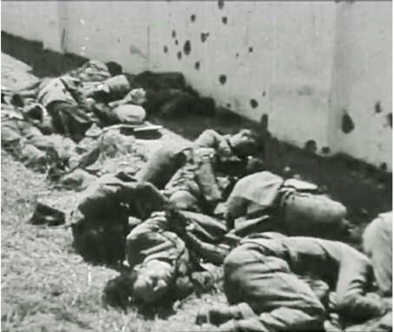
Figura 30. Cementerio de San Juan de Badajoz. 18 de agosto de 1936. Cadáveres de carabineros y un guardia civil fusilados en la tapias del camposanto