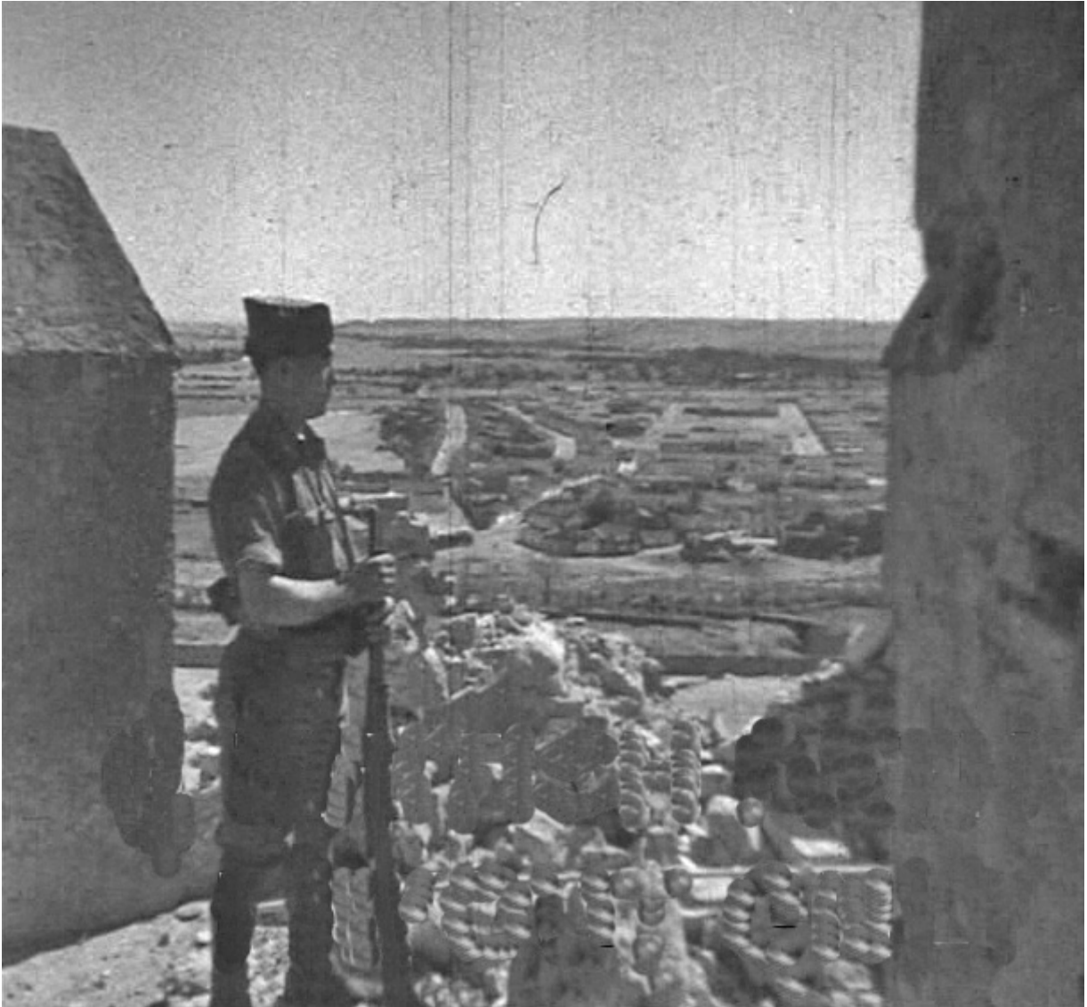
Figura 25. Badajoz. 17 de agosto de 1936. Un legionario vigila desde la Torre de Espantaperros, en la alcazaba pacense