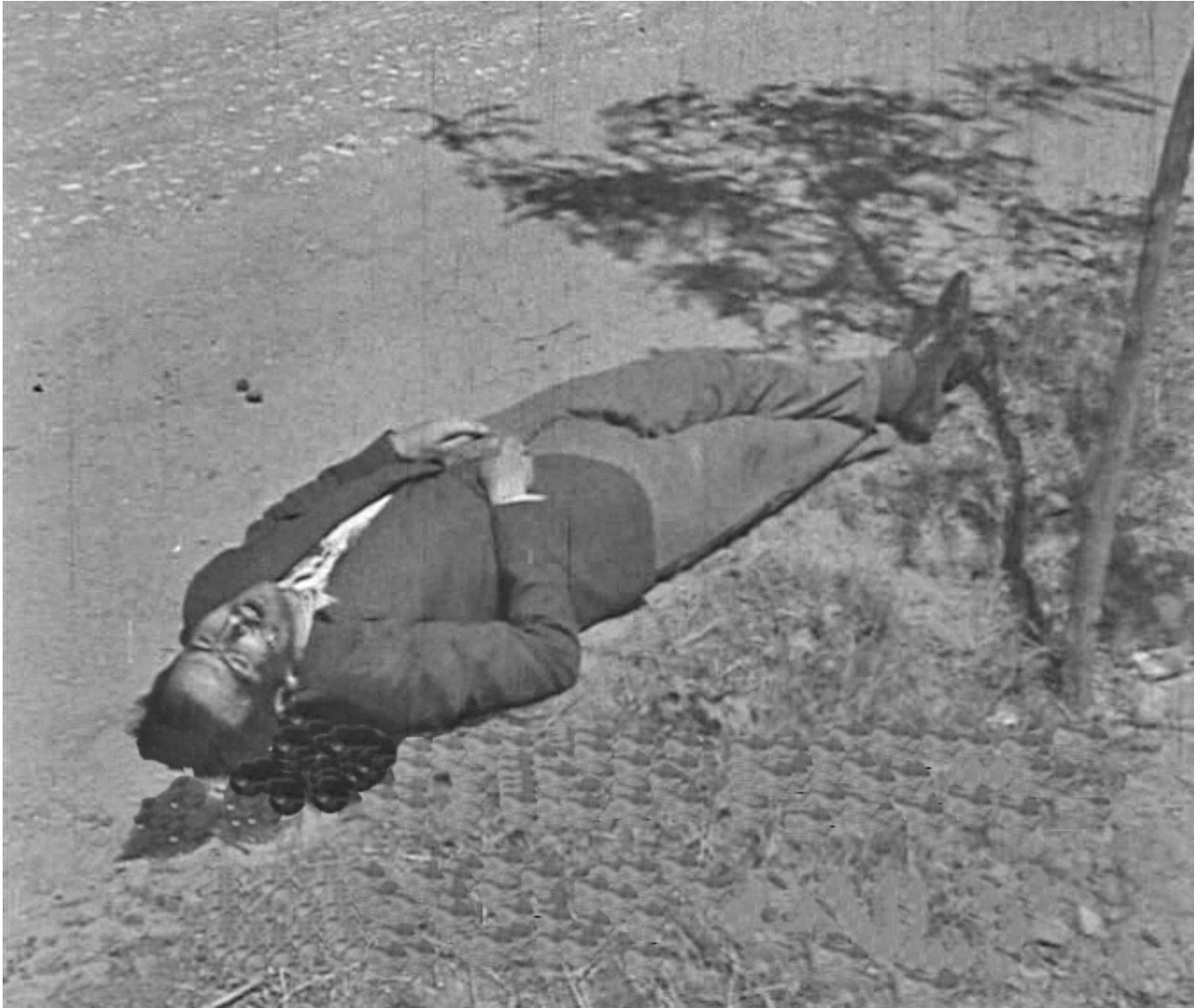
Figura 8. 17 de agosto de 1936. Entrada de Badajoz por la carretera de circunvalación. Otro cadáver junto a la carretera