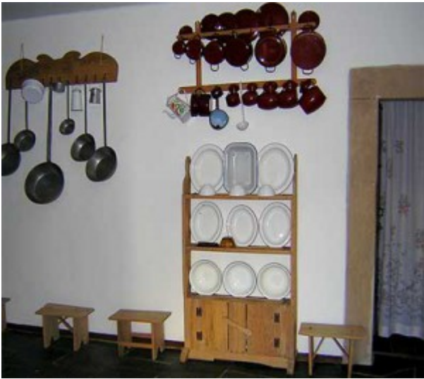
tera y locero