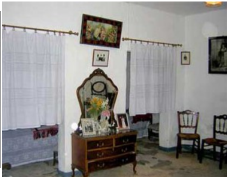
Sala y alcobas gemelas