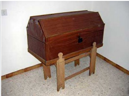
Baúl y burrillas