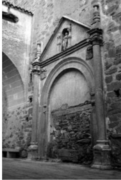
Portada de poniente de S Martín Portada de la parroquia de Jaraicejo