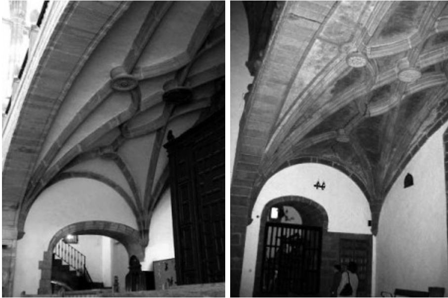
Bóvedas del coro de San Martín Bóvedas del coro de Santiago en Garciaz