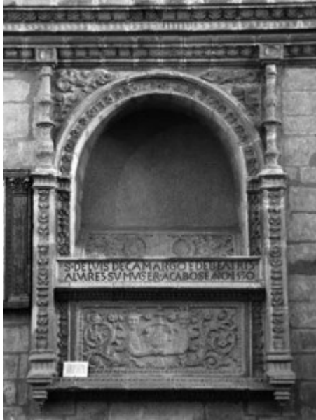
Sepulcro de Luis de Camargo 1530

Llegamos a la cabecera que se encuentra elevada por encima del nivel del resto de la nave.