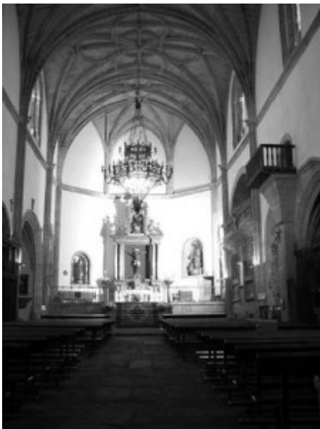
Nave de la iglesia vista desde los pies

Los restos más evidentes de una construcción previa a la de principios del XVI se encuentran en la esquina noroeste, pegados a la torre y alrededor de la puerta de las limas.