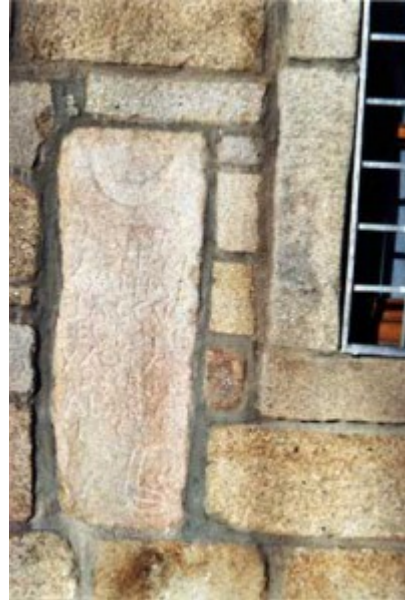
Estelas ubicadas en el exterior del edificio, en al plaza de Villanueva de la Sierra. Estado actual: agosto 1999