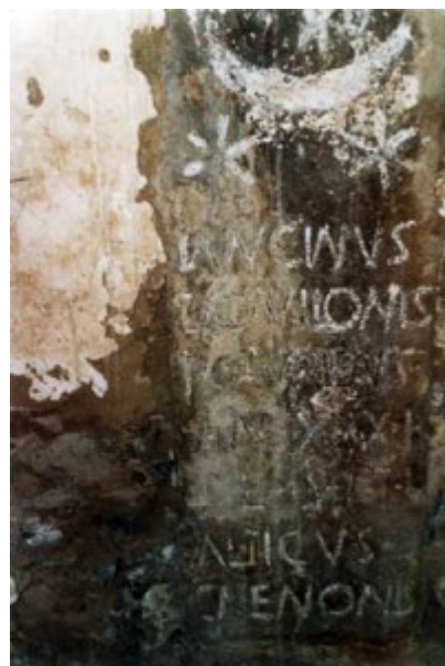
Estado en que las dejé después de quitar la capa de cal que las cubría. Año 1990