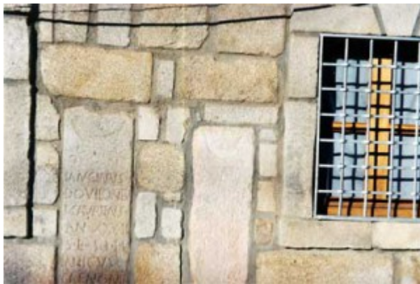
Pared fachada, antes cuartel, hoy vivienda particular, plaza. Estado actual

Esta es la estructura de la pared medianera encontrada al derruir la casa-cuartel de la Guardia Civil, que la separaba de la casa Durán. La pared estaba enlucida con cal y una vez retirada aparecieron los elementos del dibujo con esta composición.