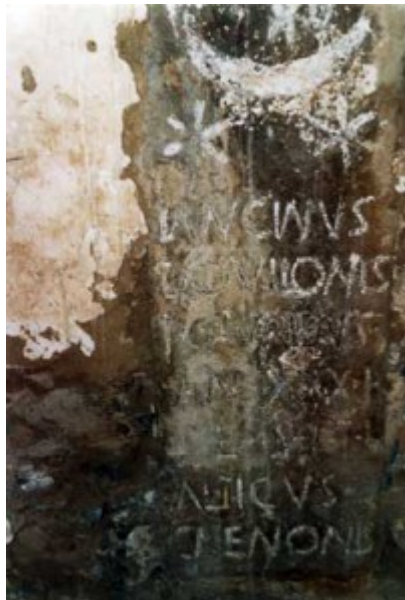
Estado en que las dejé después de quitar la capa de cal que las cubría. Año 1990