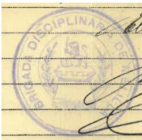
Lámina 2. Brigada Disciplinaria de Melilla 1922