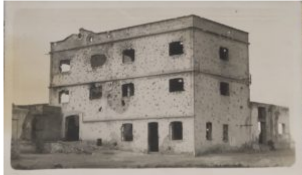
Lámina 5. Fábrica de Harina, Nador 1921, colecc familiar 001