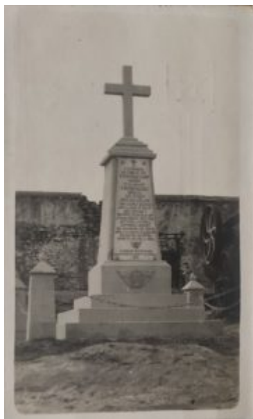
Lámina 1. A los defensores de la Fábrica de Harina, Nador 1922, colecc familiar 001