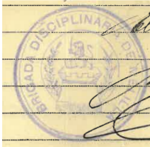
Lámina 2. Brigada Disciplinaria de Melilla 1922